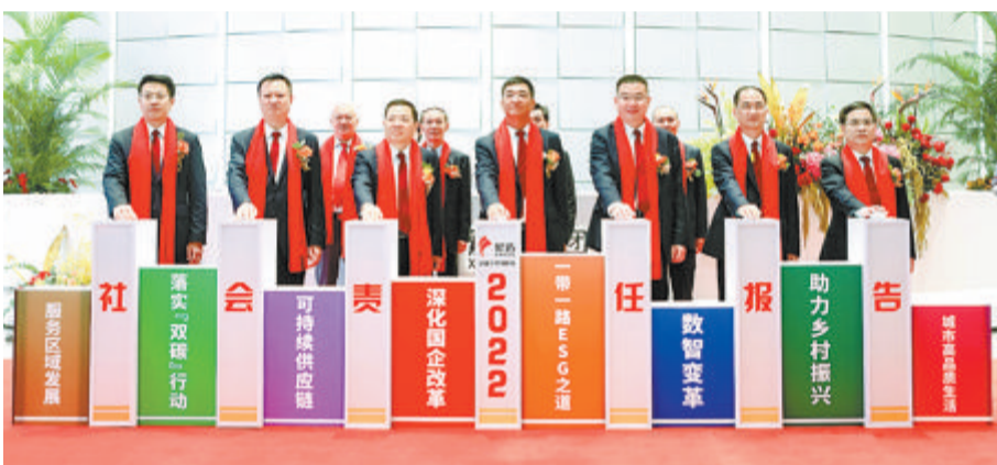
▲象屿集团2022年度社会责任报告发布，表达共生共荣、共享共赢的坚定决心。

站在百年变局的十字路口，象屿人更把对新发展格局、新增长引擎、新业务模式的思考和追求，把对 ESG 理念的深度认同与实践融入新“家”，打造出服务、共享、创新、开放的标杆总部。