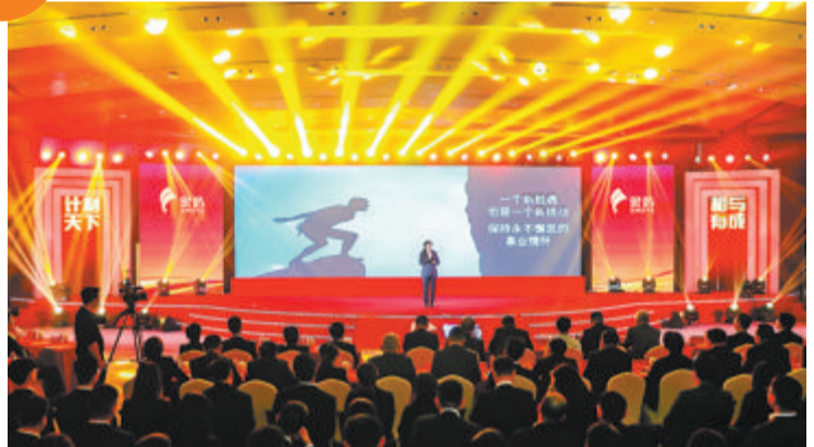
▲昨日，象屿集团2022年党建理论宣讲轻骑兵巡回宣讲厦门站在象屿集团大厦举行。

大道之行，壮阔无垠。站在党的二十大开启的新征程中，象屿人以总部大厦启用为新起点，再次吹响继续开来、接续奋斗的冲锋号角。昨天下午，象屿集团2022年党建理论宣讲轻骑兵巡回宣讲厦门站在象屿集团大厦举行。象屿人以这一独具特色的党建文化活动，推动学习贯彻党的二十大精神，为新征程锚定红色原点、鼓足文化风帆。