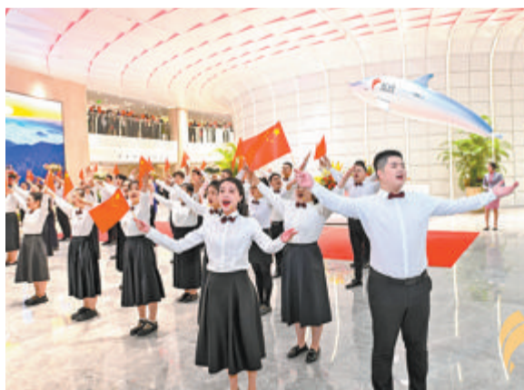
▲晨帆合唱团献上音乐快闪，唱响爱党爱国、矢志追梦的象屿之歌。

大厦投用后，象屿集团总部及在厦投资企业将共同入驻办公，充分发挥总部集聚效应，积极构建新场景、引进新业态、塑造新动能，进一步推动集团各项业务协同发展，有力保障供应链稳定畅通，助推区域产业升级，为厦门“两高两化”建设再立新功。