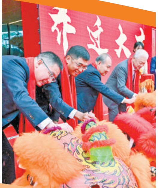
醒狮点睛，祝福象屿集团乔迁大吉、宏图大展。