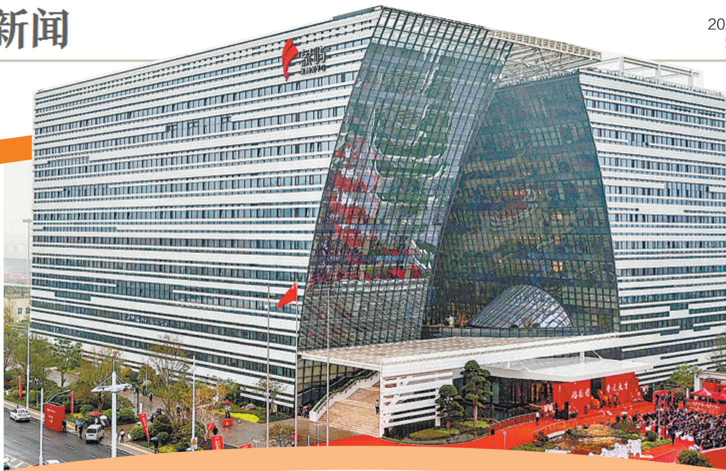
象屿集团大厦正式启用。