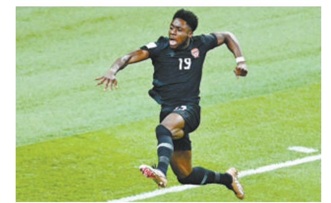
阿方索·戴维斯庆祝进球。