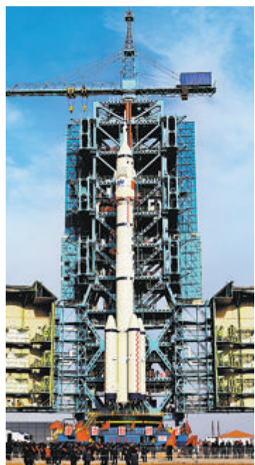
神舟十五号载人飞行任务27日进行最后一次全区合练和全系统气密性检查。目前，发射前各项准备工作已基本就绪。图为21日神舟十五号载人飞船与长征二号F遥十五运载火箭组合体转运至发射区。