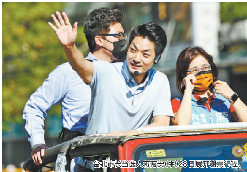
台北市市长当選人蒋万安(中)28日展开谢票行程。

据了解，蒋万安1978年生于台北市，曾在台湾政治大学就读，获美国宾夕法尼亚大学法律博士学位，2007年获美国加州执业律师资格，后从事IPO(首次公开募股)等业务。2011年，他在旧金山与人合伙创办法律事务所。2015年，蒋万安登记参加国民党台北市第三选区第九届党初选，初选前主动到“美国在台协会”放弃美国绿卡。之后他战胜了曾打败父亲蒋孝严的罗淑蕾，这也被台岛媒体称为“王子