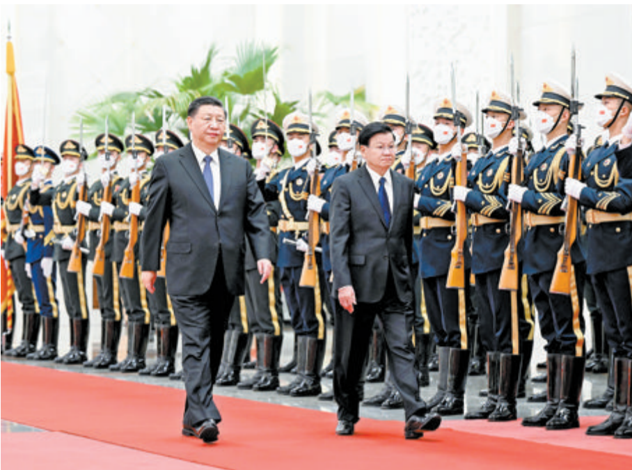
11月30日,中共中央总书记、国家主席习近平在北京人民大会堂同老挝人民革命党中央总书记、国家主席通伦举行会谈。

新华社北京11月30日电 11月30日,中共中央总书记、国家主席习近平在北京人民大会堂同老挝人民革命党中央总书记、国家主席通伦举行会谈。双方强调,要秉持“长期稳定、睦邻友好、彼此信赖、全面合作”方针和“好邻居、好朋友、好同志、好伙伴”精神,政治上互尊互信、经济上互惠互利、人文上相知相亲,不断深化中老命运共同体建设,为推动构建人类命运共同体作出积极努力和贡献。