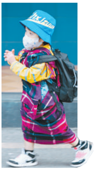
市民纷纷换上冬装。