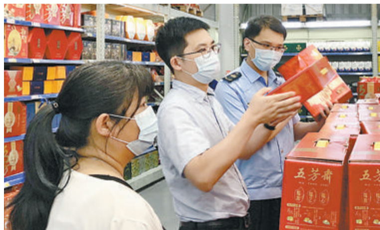
▲紧盯节点，开展落实中央八项规定精神的“1+X”专项督查，前往商场、超市检查是否存在公款购买节礼、购物卡等问题。

2013年以来，全市共查处违反中央八项规定精神问题1384起，批评教育帮助和处理1840人，党纪政务处分880人。其中，享乐主义奢靡之风问题1076起，批评教育帮助和处理1342人，处分744人；形式主义官僚主义问题308起，批评教育帮助和处理498人，处分136人。享乐主义奢靡之风查处问题中占前五位的分别是公车管理使用问题(305起，占28.3%)、违规收受礼品礼金问题(301起，占28.0%)、违规发放津贴或福利问题(132起，占12.3%)、公款旅游问题(106起，占9.9%)、违规吃喝问题