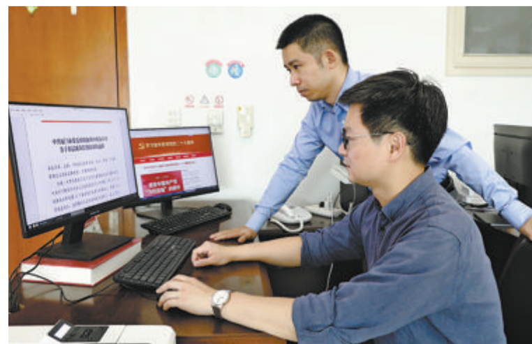
▲通过厦门党政机关统一办公平台开展基层减负动态监测，及时通报曝光。

(66起，占6.1%)；形式主义官僚主义查处问题主要集中在履职尽责、服务经济社会发展和生态环境保护方面不担当、不作为、乱作为、假作为方面(162起，占52.6%)。2018年以来，全市各级纪检监察机关共查处违反中央八项规定精神问题821起，批评教育帮助和处理1105人(党纪政务处分538人，处分比例约50%)。2021年开始，相关指标呈现明显下降态势，当年度查处问题数同比降低36.8%，处理人数同比降低39.3%，处分人数同比降低42.5%，“四风”问题得到有效遏制。