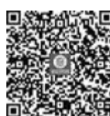
扫码了解线路运营方案

本次接驳线中,地铁湖里创新园站、地铁中山公园站、地铁杏锦路站、地铁浦边站等地铁站点为主要接驳重点;岛内厦大片区、中山路、集美大学康城、翔安九溪小区等居住区、围里城中村为重点覆盖区域。同时,结合海沧枢纽站试运营,新增兴港花园、海沧生活区的接驳线。此外,华西医院片区的918路加密班次优化提升为接驳线。