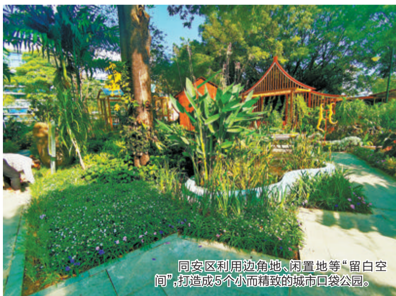
同安区利用边角地、闲置地等“留白空间”,打造成5个小而精致的城市口袋公园。

“建成后的生物园,不仅提高了颜值,更是露天的生物学课堂和实验室,可以加强教学和实验的联系,能使学