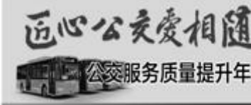
匠心公交爱相随 公交服务质量提升年