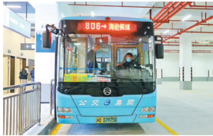
昨日,“海沧枢纽站”公交首末站启用。