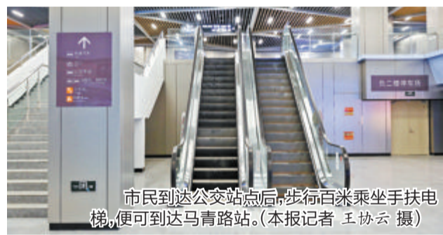
市民到达公交站点后,步行百米乘坐手扶电梯,便可到达马青路站。