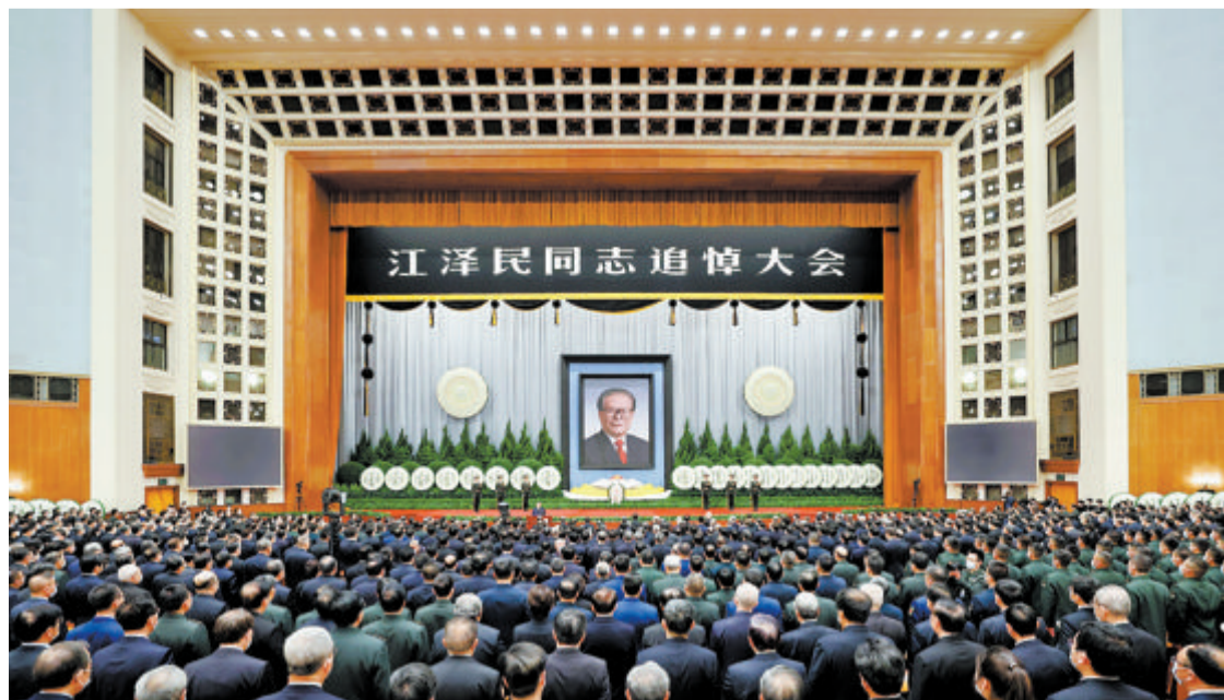
▲12月6日，中共中央、全国人大常委会、国务院、全国政协、中央军委在北京人民大会堂隆重举行江泽民同志追悼大会。