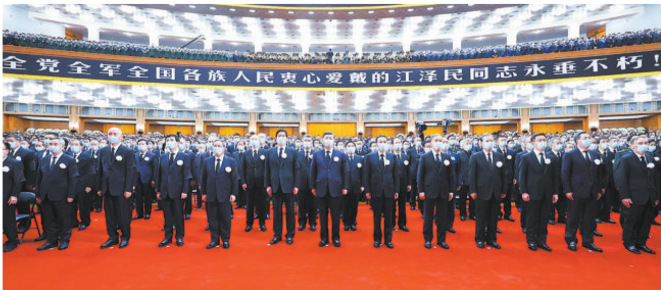
▲12月6日，中共中央、全国人大常委会、国务院、全国政协、中央军委在北京人民大会堂隆重举行江泽民同志追悼大会。习近平、李克强、栗战书、汪洋、李强、赵乐际、王沪宁、韩正、蔡奇、丁薛祥、李希、王岐山等参加大会。