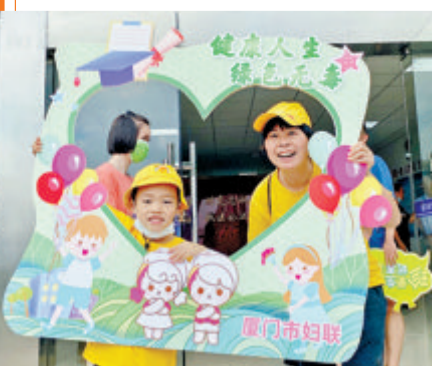
▲市妇联组织亲子家庭探秘厦门警犬基地。