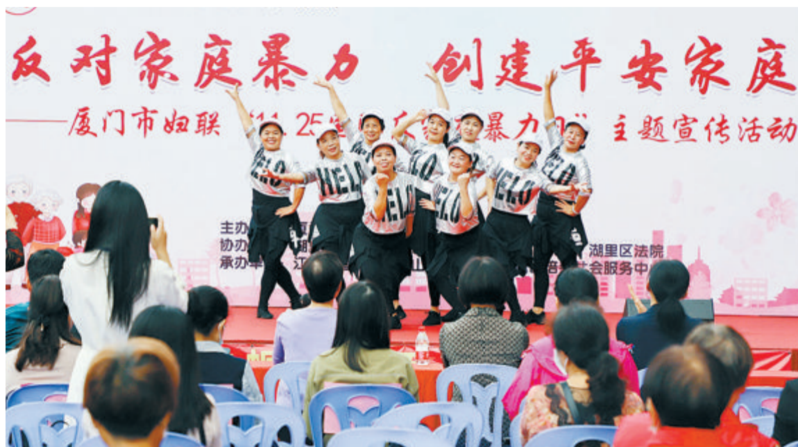
市妇联开展“11·25国际反家庭暴力日”主题宣传活动。

厦门市妇联认真学习贯彻党的二十大精神，坚持高起点谋划、高标准要求、高质量落实。打造“特区版”“有温度”“更高效”的妇联维权工作机制，为建设更高水平的平安厦门做出积极贡献。