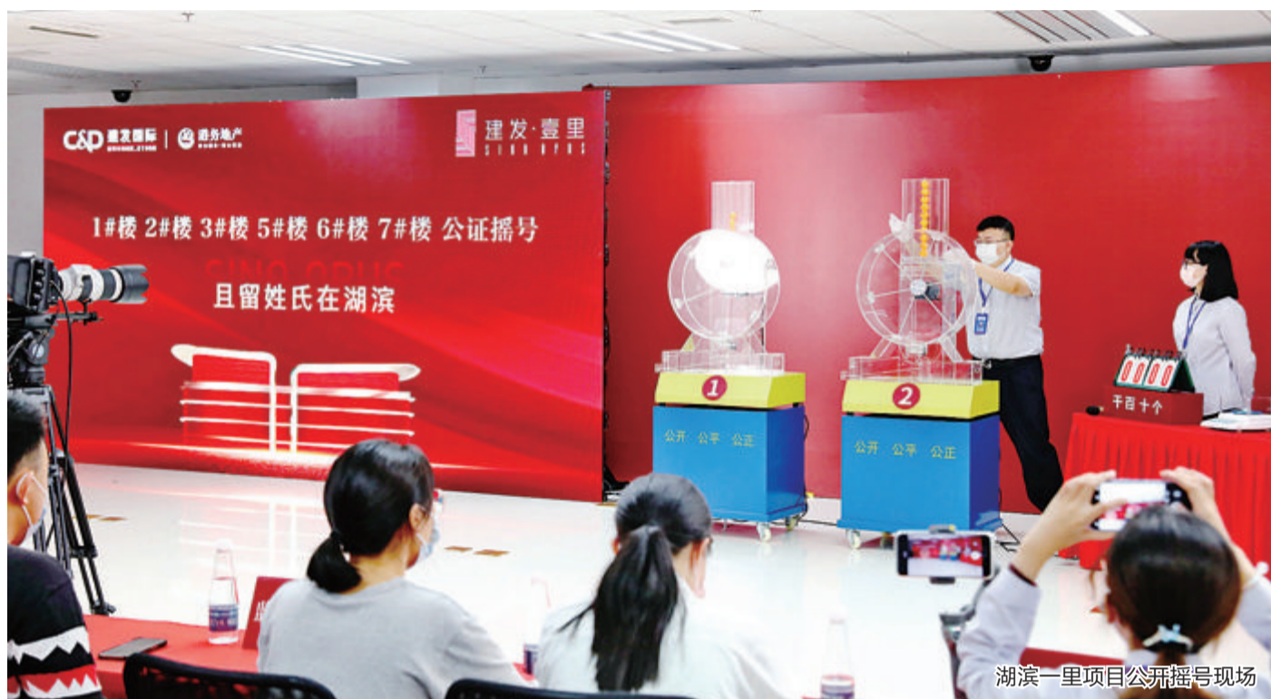
湖滨一里项目公开摇号现场