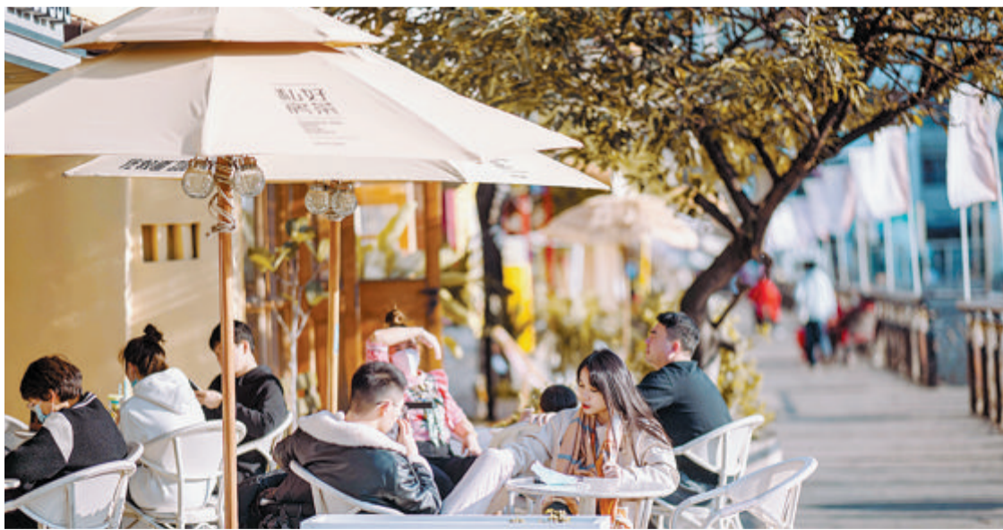
►昨天天气晴好,市民在沙坡尾享受午后阳光。

本报讯(记者 朱道衡)闽南民谚说“三日风,三日霜,三日日头公。”昨天冷空气偷了个懒,日头公露面,鹭岛午间暖意融融。气象部门预测,今天我市继续在“回暖通道”上前进,明天冬至节气,新一股冷空气南下,将带来大风和降温天气,市民注意防范。