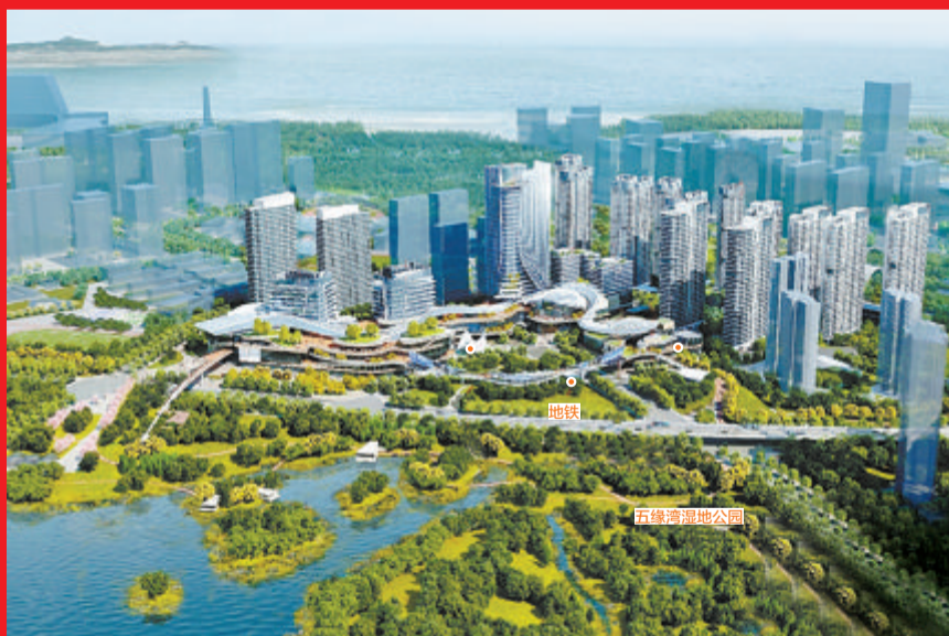
全省首个TOD成片开发项目——五缘湾湿地公园项目，涵盖住宅、办公、商业、公寓等复合功能。(效果图/岛内大提升指挥部 供图)