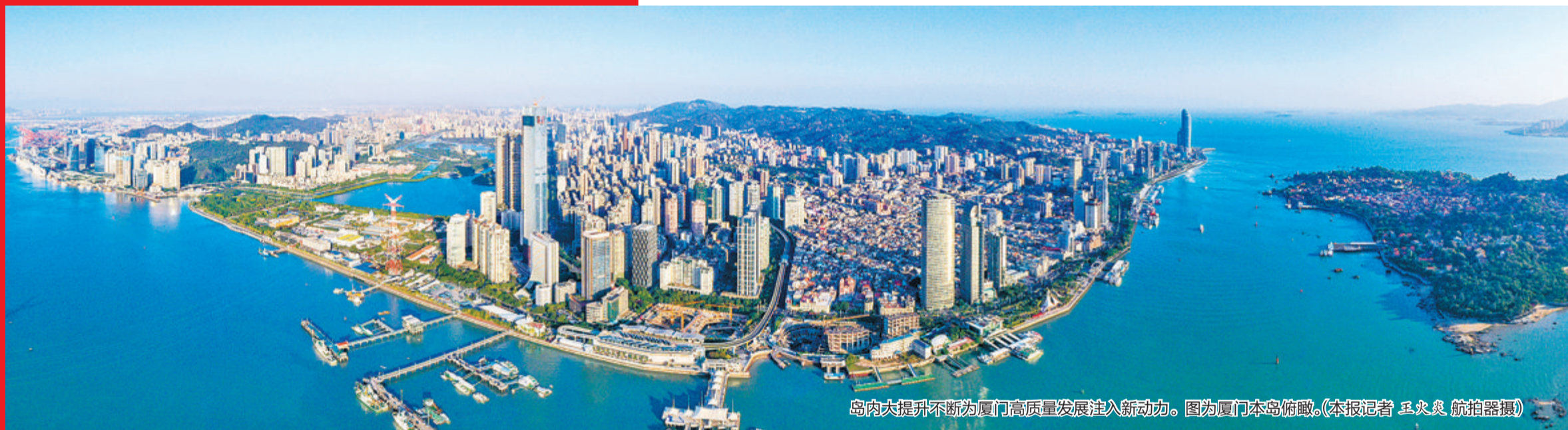
岛内大提升不断为厦门高质量发展注入新动力。图为厦门本岛俯瞰。

在探索新开发模式上，指挥部同样落子有声。围绕如何发挥轨道最大效益，全省首个TOD成片开发试点项目——“五缘湾湿地公园项目”给出答案：站城一体、产业优先、功能复合、综合运营。综合业态，提升品质与价值；复合业态，以长期整体效益，从而达到综合平衡。立体交通、“风雨无阻”无障碍转化，打造“绿色、开放、共享”的现代化城市新样板。