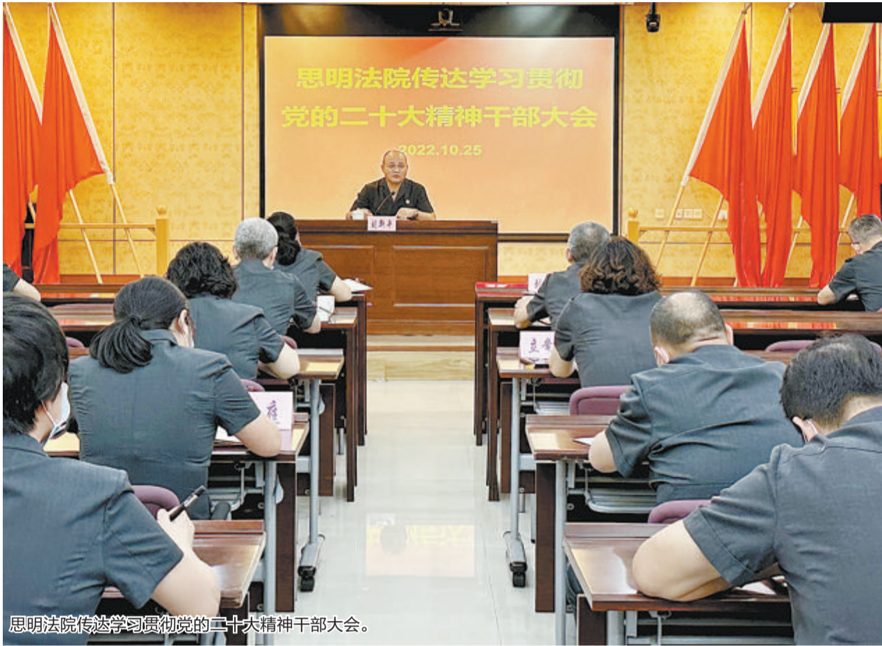
思明法院传达学习贯彻党的二十大精神干部大会。