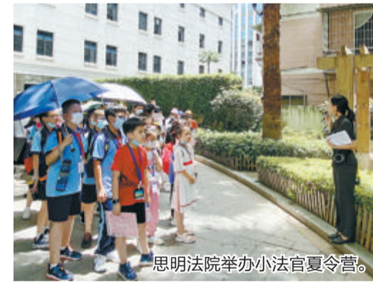
思明法院举办小法官夏令营。

思明法院继2021年获评“全省优秀法院”之后,今年又荣获“全国优秀法院”“人民法院政治工作先进集体”“全国政法新媒体先进单位”。全年获市级以上集体荣誉15个,个人荣誉45人次,涌现出“全国法院先进个人”等模范典型。