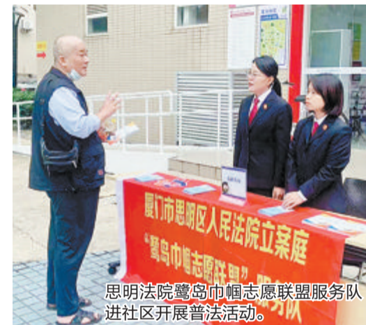
思明法院鹭岛巾帼志愿联盟服务队进社区开展普法活动。