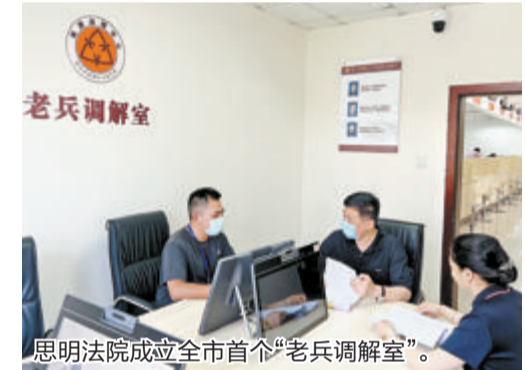
思明法院成立全市首个“老兵调解室”。

建活动,推出家事纠纷心理辅导等13个为民办实事精品项目。——以抓学术调研促人才培养,全院14人次获评省市两级审判业务专家、法院调研人才,18个案例、文书、庭审、司法建议获评省级以上奖项。