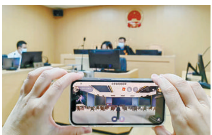
▲思明法院开展全国首场“元宇宙”庭审。

率同比增长13.3%,开展专项执行行动10场,腾退房屋、土地面积近1.6万平方米。限制高消费1.8万人,曝光失信被执行人602人,罚款、拘留194人,追究拒执刑事责任21人……这组看似简单的数据,其背后是思明法院践行公正司法和司法为民的生动实践,更是全体执行干警勇于担当、履职尽责的有力印证。