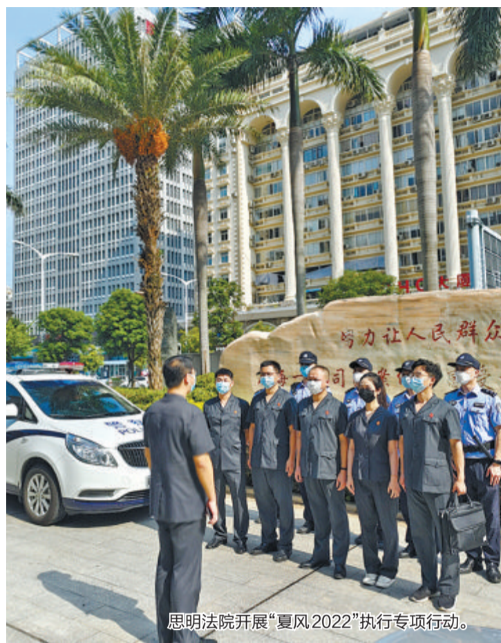
思明法院开展“夏风2022”执行专项行动。