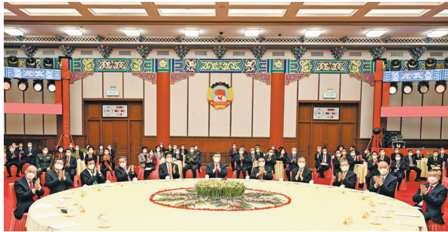
▼党和国家领导人习近平、李克强、栗战书、汪洋、李强、赵乐际、王沪宁、蔡奇、丁薛祥、李希、王岐山出席茶话会并观看演出。

新华社北京12月30日电 中国人民政治协商会议全国委员会12月30日上午在全国政协礼堂举行新年茶话会。党和国家领导人习近平、李克强、栗战书、汪洋、李强、赵乐际、王沪宁、蔡奇、丁薛祥、李希、王岐山等同各民主党派中央、全国工商联负责人和无党派人士代表、中央和国家机关有关方面负责人以及首都各界人士代表欢聚一堂,共迎2023年元旦。