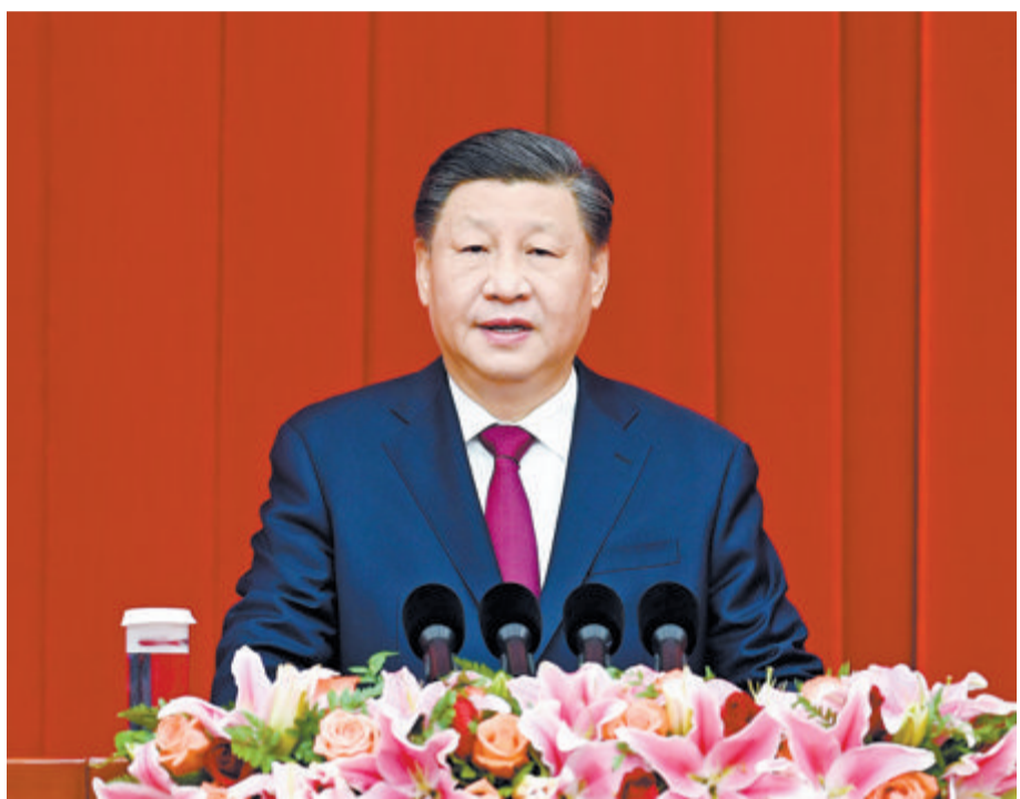
▲12月30日,全国政协在北京举行新年茶话会。中共中央总书记、国家主席、中央军委主席习近平在茶话会上发表重要讲话。