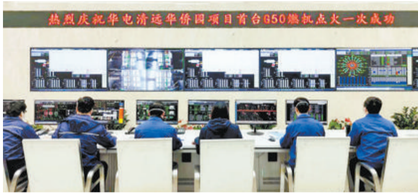
▲2022年12月31日,华电清远华侨工业园内,操作控制室庆祝首台国产F级50兆瓦重型燃气轮机点火成功。

新华社广州1月1日电 历时13年自主研发,被誉为“争气机”的首台国产F级50兆瓦重型燃气轮机,于2022年12月31日在华电清远华侨工业园天然气分布式能源站,实现首次点火成功。这标志着东方电气集团自主研发的F级50兆瓦重型燃气轮机向商业化运行又迈出一步,中国将开启自主燃气轮机高质量发展的新篇章。