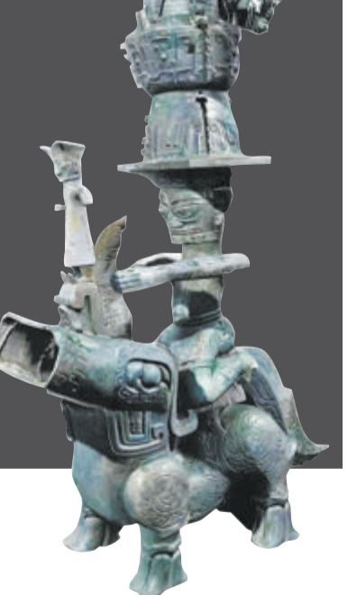
考古工作者用三维扫描技术，实现三星堆文物拼对合体。

据了解，这种神兽驮人、人顶尊的造型，在研究人员看来应该是三星堆人祭祀时的场景之一，可能反映了他的某种宇宙观和世界观。