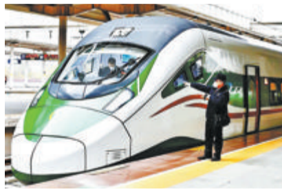
图为新型CR200J复兴号动车组。