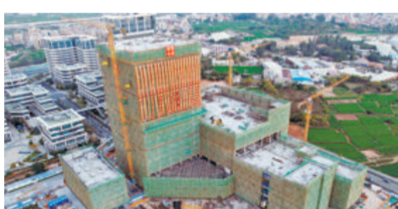
位于翔安区的生物制品科学与技术福建省创新实验室一期工程主体结构顺利封顶。

作为福建省、厦门市政府和厦门大学三方共建共管项目, 生物制品科学与技术福建省创新实验室项目是福建省第一家省级生物创新实验室, 也是迄今为止厦门市在生物医药领域财政投资