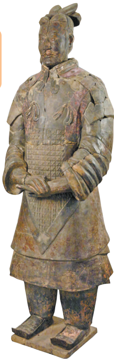
一号坑第三次考古发掘发现的将军俑。

综合新华社电、央视新闻报道 陕西省文物局昨日发布2022年度陕西重要考古发现，其中秦始皇帝陵考古发掘又有新收获。考古工作者对陵园外围的大型陪葬坑——一号坑进行了持续十余年的第三次考古发掘，新发现陶俑220余件，并初步厘清秦军阵的排列规律，还明确了秦陵陶俑的制作程序。