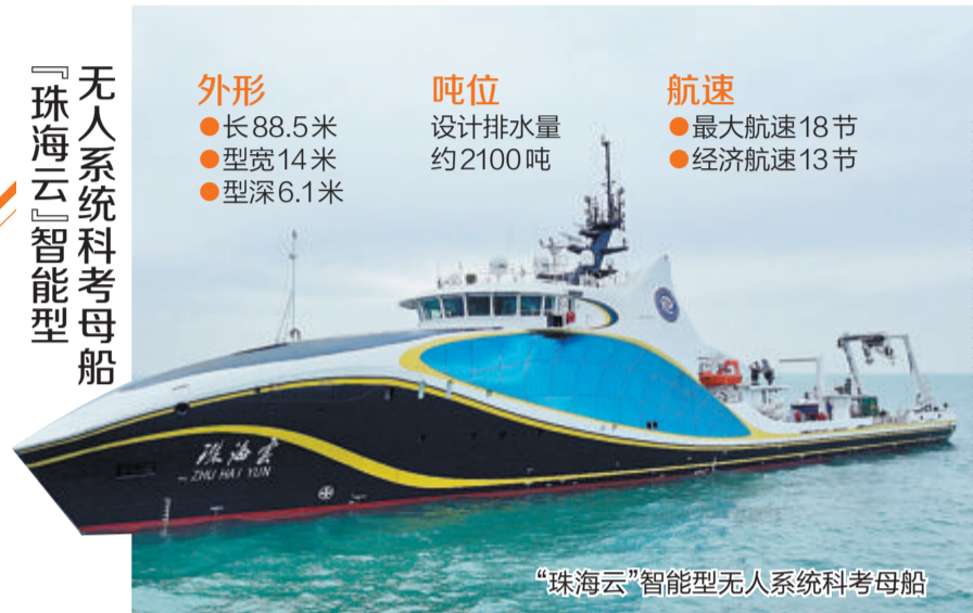
“珠海云”智能型无人系统科考母船