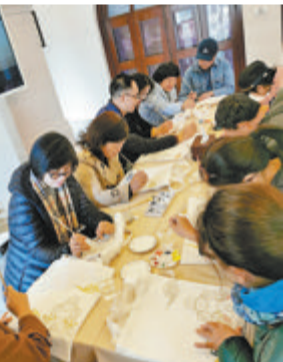
故宫鼓浪屿外国文物馆开展文创产品相关活动,吸引许多市民游客参与。

“让公众在欣赏精美文物的同时,通过文创产品深度感受传统文化的魅力,也增进了行业内的交流互动,将