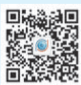
扫码关注“厦门党风政风监督台”微信公众号

注“鹭岛清风”微信公众号,通过“四风”举报端口进行举报。您还可通过“厦门党风政风监督台”微信公众号,与市党风政风监督员、相关媒体进行互动。