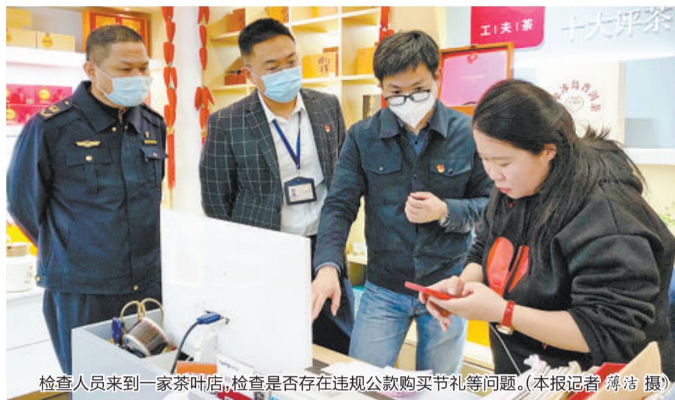
检查人员来到一家茶叶店,检查是否存在违规公款购买礼品等问题。

“我们将通过专题学习、作风微课堂等多种形式组织再学习、再教育,督促领导干部严于律己、严负其责、严管所辖。”市纪委监委相关负责人表示,专项整治期间,各级纪检监察机关将积极推动党委(党组)认真履行好管党治党政治责任,开展经常性纪律教育,真正把纪律严起来,把规矩立起来,营造遵规守纪的浓厚氛围。市纪委监委也将深入研判“四风”形势,深化运用“1+X”监督机制,加强与财政、审计、市场监管等职能部门的协作配合,把职能部门查“事”与纪检监察机关查“人”有机结合,加强问题线索督查督办,并有效激活“市区联动”和“室组”“室组企”联动等督查机制,织牢织密监督网络。