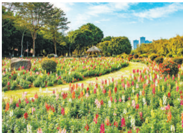
▲园博苑2023年春节花卉展准备就绪。(林斌亨 摄)

买年货、品美食、游景区、赏美景、住酒店……作为厦门首个国家全域旅游示范区,这个春节假期,集美区铆足了劲“放大招”,联动各景区、商圈推出一系列丰富多彩的消费、文旅优惠活动,“一站式”承包您的假期,加快打造集美“中央活力区(CAZ)”,塑造“亲子胜地”品牌。