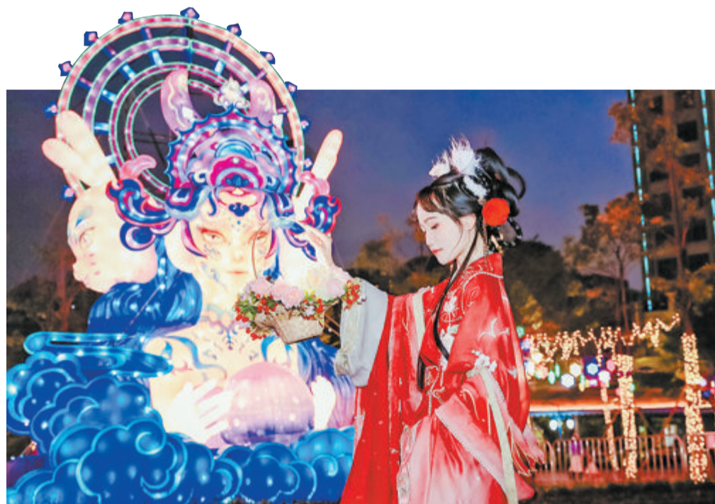
▲厦门灵玲国际马戏城为市民游客奉上新意十足、潮味满满的新春彩灯盛宴。

摘果子、喂动物、做手工……和孩子一起体验田园劳作乐趣。春节期间,集美的果乐园、大地农场研学基地等都推出了兔年主题活动,在大地农场研学基地,大朋友、小朋友不仅可以体验下水捞鱼、鸡窝捡鸡蛋等“农家乐”,还能和孩子一起认种、认领小菜园,学习国学、礼射等传统文化。