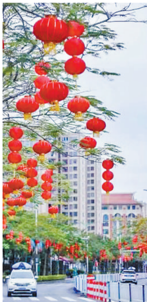
▼集美大街小巷张灯结彩,年味渐浓。