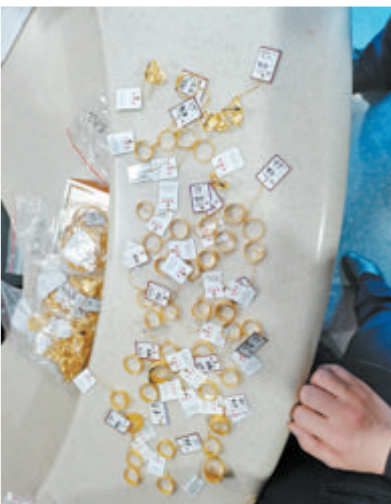
▲遗落在车上的双肩包里的首饰。

厦门铁路公安处乘警支队温馨提示:春运期间,出行旅客携带行李较多,容易出现少拿、错拿,广大旅客乘车出行,如果遇到此情况,请第一时间拨打12306求助或者找到铁路公安报警求助。