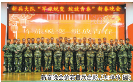
新春晚会参演官兵合影。

本报讯(记者 蔡镇全 通讯员 苏胡鑫 陈景泰 柯雄伟)“听吧,新征程号角吹响,强军目标召唤在前方……”伴随全体官兵的合唱声,近日,一场主题为“军旅蜕变 绽放青春”的新春晚会在武警厦门支队新兵大队拉开了序幕。