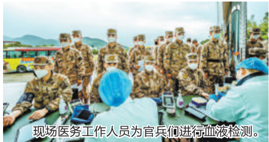
现场医务工作人员为官兵们进行血液检测。

本报讯(文/图 记者 蔡镇全 通讯员 黄志伟)大爱无私甘奉献,情暖鹭岛勇担当。日前,厦门用血紧张的消息传到第73集团军某旅后,官兵们主动挽袖献血,用行动有效缓解了驻地临床用血紧张的局面。