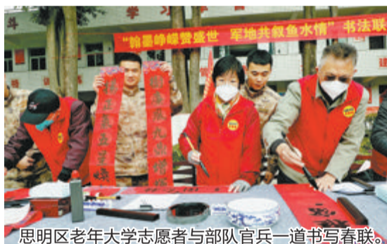
思明区老年大学志愿者与部队官兵一道书写春联。

本报讯(文/图 通讯员 刘礼鹏 吴芷菁)1月17日,海军驻厦某部举办“翰墨峥嵘赞盛世,军地共叙鱼水情”书法联创活动,以迎新春的喜气走进军营、温暖官兵。这次书法联创活动,海军驻厦某部邀请了厦门思明区老年大学的志愿者与部队官兵一道书写新春祝福、表达新年愿望,为军营捎来兔年喜庆,共叙鱼水深情。