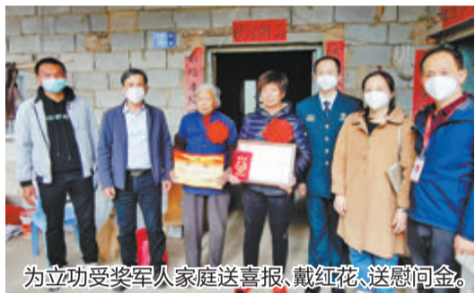
为立功受奖军人家庭送喜报、戴红花、送慰问金。

本报讯(文/图 通讯员 黄彦奕 吴诗雨)“恭喜,您家孩子在部队立功了,感谢你们为国家、为部队培养了优秀军人。”春节前夕,翔安区人武部会同区退役军人事务局积极开展为立功受奖军人家庭送喜报活动。