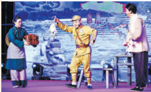
▲根据厦门破狱斗争创作的高甲现代小戏《送枪》获得全国“群星奖”戏剧类节目入围奖。