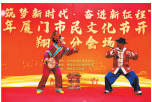
▲在翔安,把非遗搬上文化惠民演出舞台,使得非遗生存的“土壤”更丰厚。