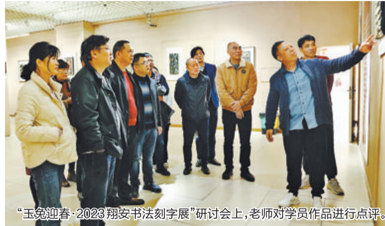
“玉兔迎春·2023翔安书法刻字展”研讨会上,老师对学员作品进行点评。

本报讯 “这件作品融合了书法艺术的线条表现,充分利用点、线、面的结合,把传统书法艺术与其他艺术形式融为一体,具有现代刻字鲜明的艺术特征。”2月1日,一场书法刻字交流研讨活动在翔安区文化馆举行,二十余位书法刻字爱好者欢聚一堂,在中国书法家协会会员、福建省书协刻字研究会副会长郑登南的带领下,对正在进行的“玉兔迎春·2023翔安书法刻字展”展出作品进行了点评,随后还进行了书法刻字座谈研讨和艺术交流。据悉,这是翔安区首次举办书法刻字专题培训和展览,也是全市文旅系统的首创之举。