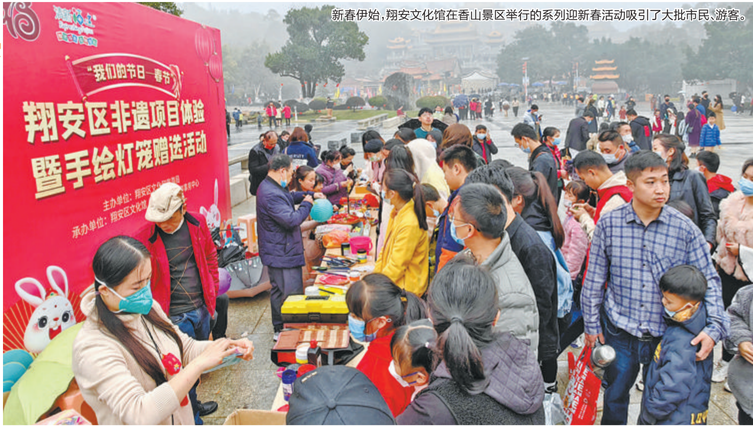
新春伊始,翔安文化馆在香山景区举行的系列迎春活动吸引了大批市民、游客。