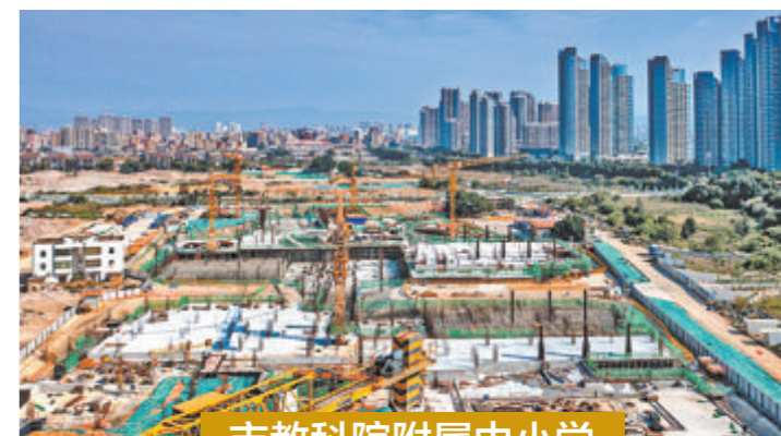
市教科院附属中小学

目前开工建设的是洪塘头TOD项目(2022TP03地块)一期项目,由7栋23F-33F的高层住宅、1栋1F物业管理用房、1栋5F社区服务用房、5栋1-2F商业、1栋变配电房组成。