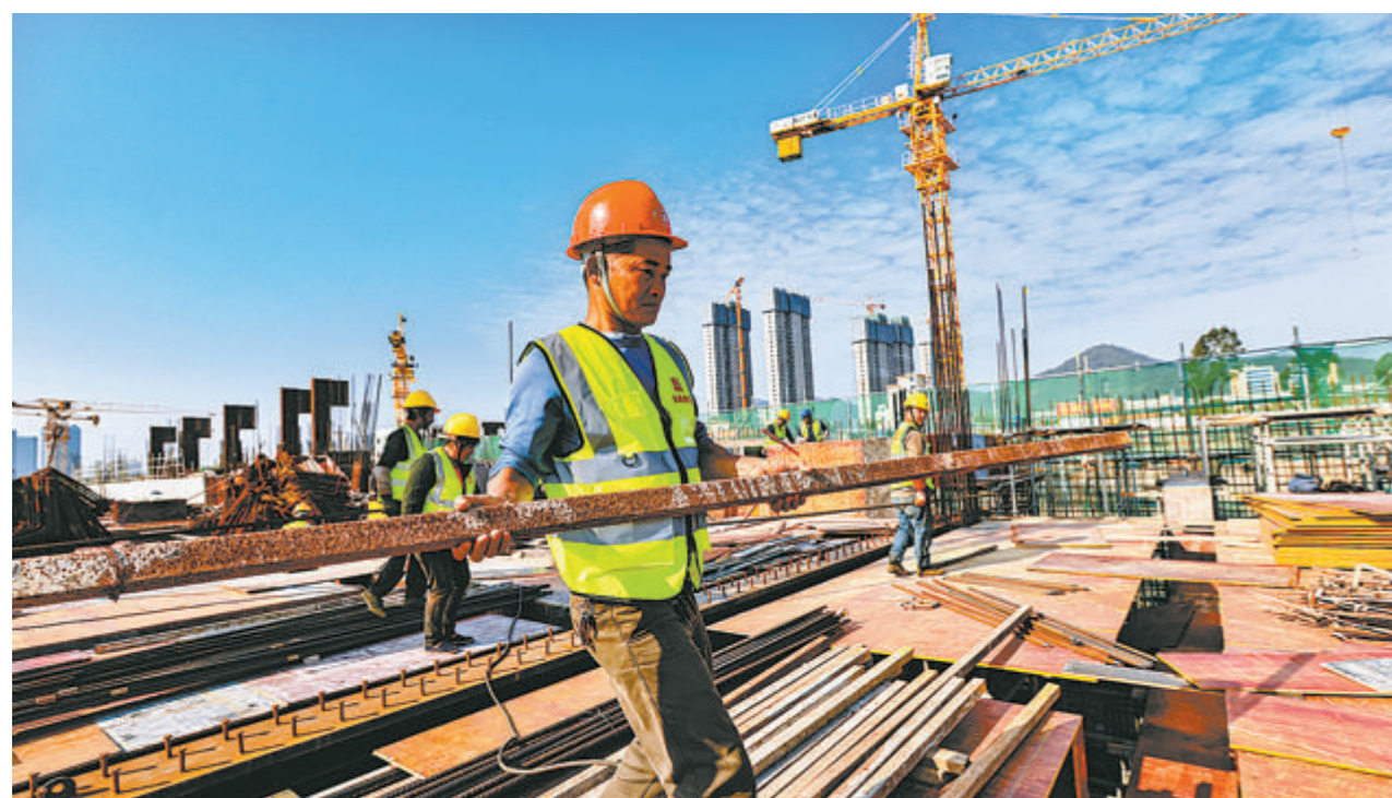
新城的多个项目部工地上,工人们已经返岗作业。

春节假期刚过,同安新城一派热火朝天的景象——中小学校、基础设施、公建配套等多个项目已经率先开工、抢抓工期。即便是在春节假期,新城300余名工人仍奋战在工地一线,确保省市重点项目不停工。