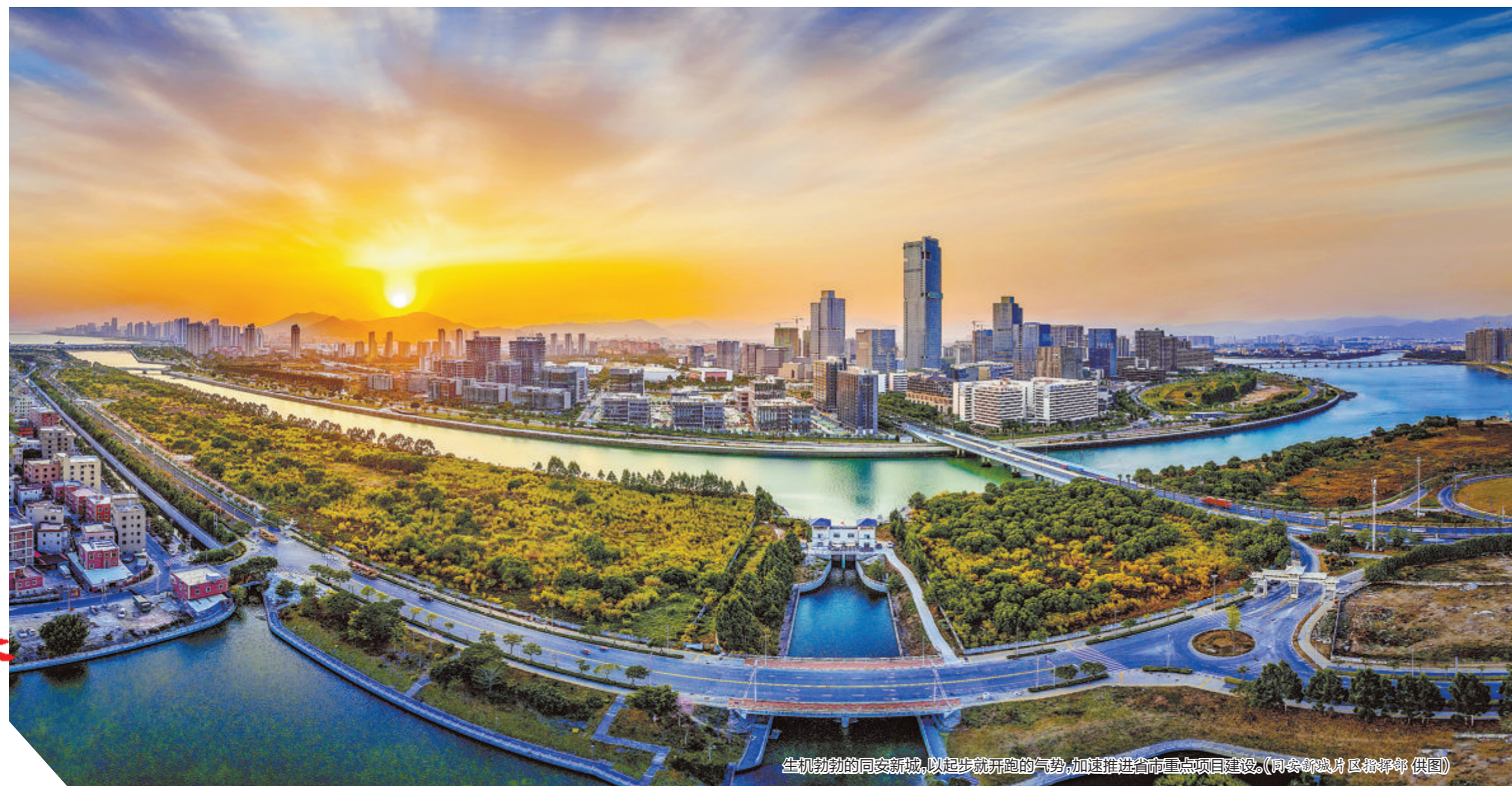
生机勃勃的同安新城,以起步就开跑的气势,加速推进省市重点项目建设。