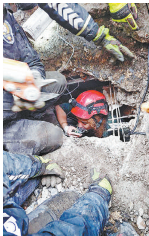
搜救人员在废墟中救人。