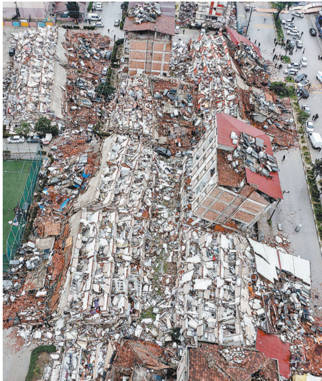
强震造成土耳其的建筑物坍塌损毁

俄罗斯、伊朗、黎巴嫩、约旦和一些欧盟国家也表示将为灾区提供援助。俄罗斯紧急情况部说,两架载有救援人员的伊尔-76运输机已准备飞往土耳其参加救灾。欧盟启动民事保护机制,为土耳其动员了搜救队,已有至少13个成员国向土耳其提供援助。来自荷兰和罗马尼亚的搜救团队已启程奔赴灾区。