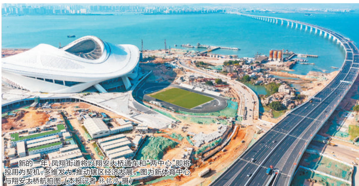
新的一年，凤翔街道将以翔安大桥通车和“两中心”即将投用为契机，多维发力，推动辖区经济发展。图为新体育中心与翔安大桥航拍图。