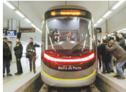
中车唐山公司交付葡萄牙的地铁列车