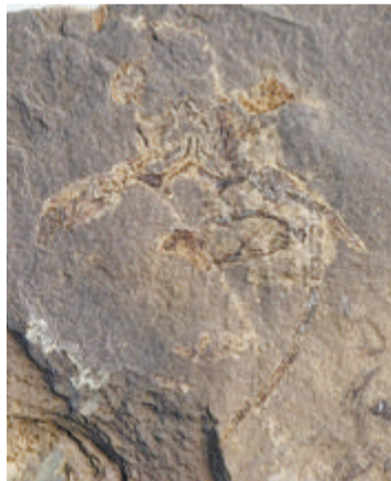
贵阳生物群发现的龙虾化石碎片