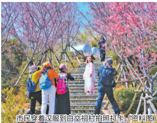
市民穿着汉服到白交祠村拍照打卡。(资料图)

本报(记者 卢漳华 通讯员 苏家华)2月25日,第三届高山寻樱·醉美汉服樱花季将在同安白交祠村举办。别具特色的汉服体验与高山上好几百棵绽放的“广州樱”邀您前来观赏游玩,享受春光。