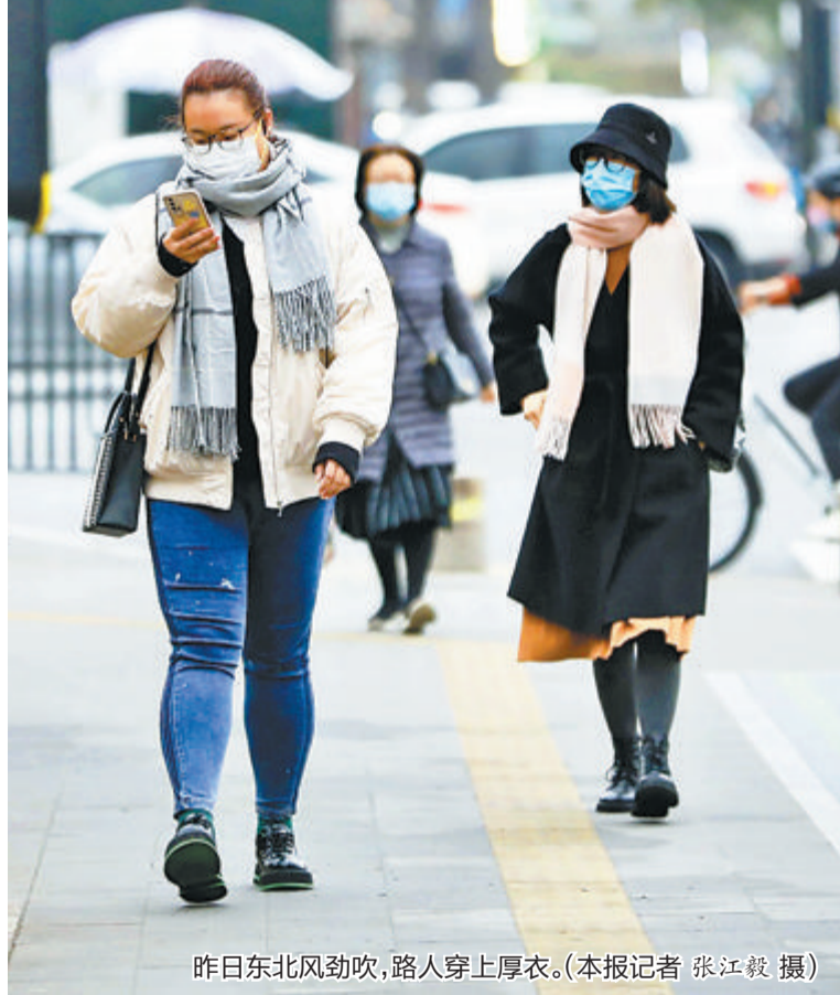
昨日东北风劲吹,路人穿上厚衣。