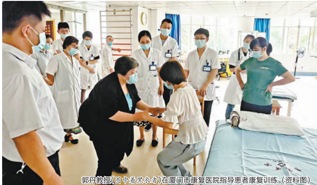
郭丹教授(图中着黑衣者)在厦门市康复医院指导患者康复训练。(资料图)

本报记者 刘蓉 通讯员 陈泓莅 为了让患者在家门口就能得到国内顶尖专家的康复治疗,厦门市康复医院作为我市首家集医疗、康复、保健、预防、教学为一体的市属公立专科康复医院,将于2月20日、21日特邀国内知名康复专家郭丹教授来厦开展康复咨询和指导。2月22日上午,郭丹教授还将面向广大市民提供免费康复咨询与指导。 据厦门市康复医院介绍,郭丹教授从事康复护理、理学疗法教学及康复治疗长达30余年,在中日友好医院和北京中医药大学从事康复工作多年,擅长多种专病诊疗研究,尤其是脑卒中康复、重症康复、外科围手术康复、骨关节康复等。 郭丹教授从2021年起多次来到市康复医院开展康复指导及学术交流,2022年9月签订了专家聘请协议。截至目前,已为110余位厦门患者进行了康复治疗指导。