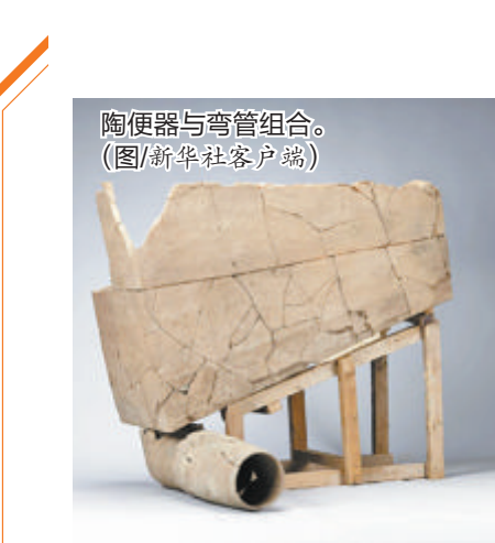
陶便器与弯管组合。