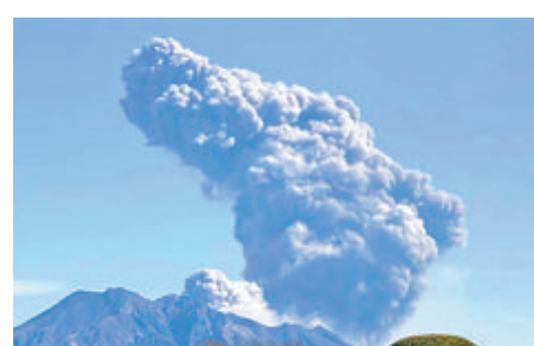
樱岛火山2月14日喷发。

据中新网报道 据日媒报道,当地时间14日,位于日本鹿儿岛县樱岛的火山再次喷发,火山灰最高喷至距离火山口2400米的高度。