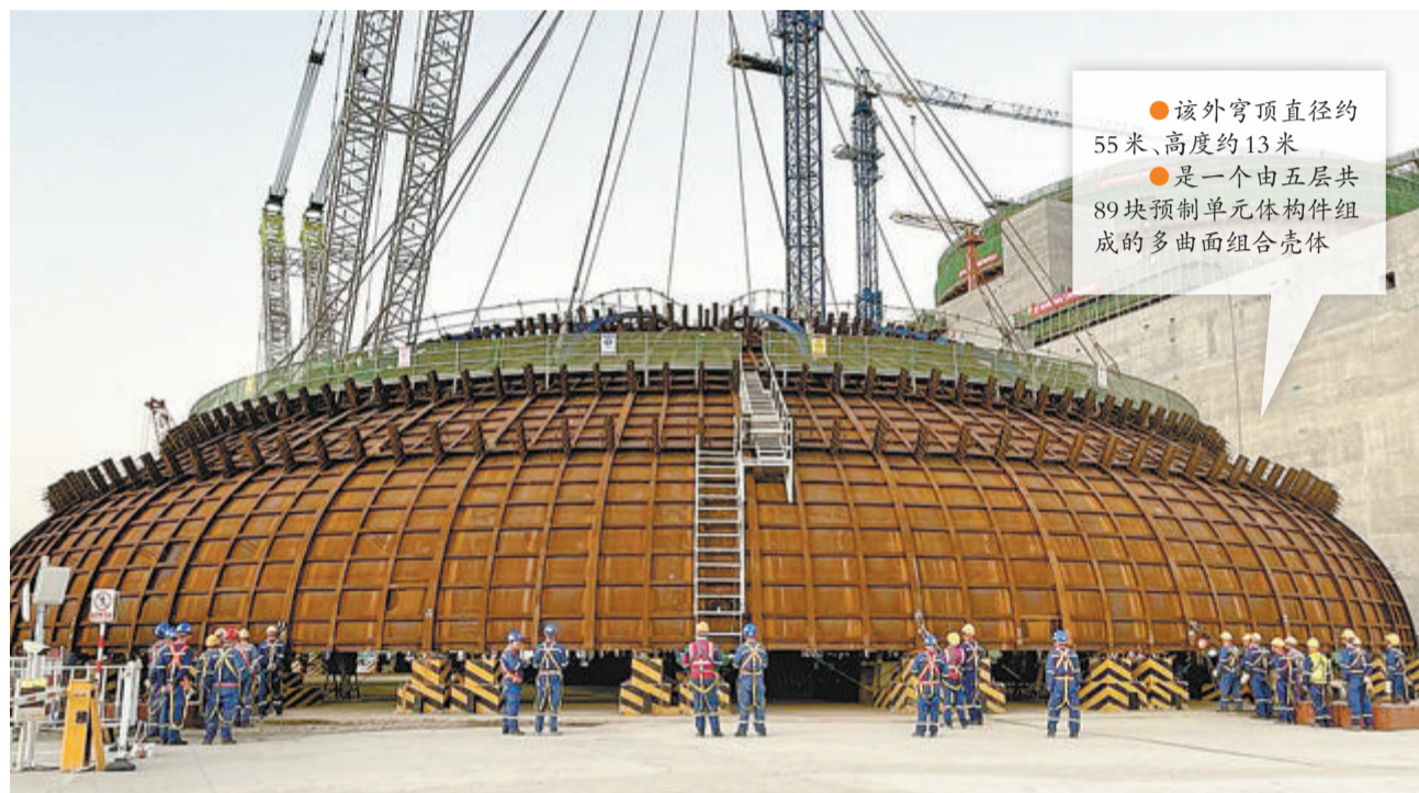
▲吊钩将外穹顶吊离地面,经过变幅、升钩、行走平移、调整等动作,平稳落钩就位。在反应堆厂房外层安全壳筒体上。