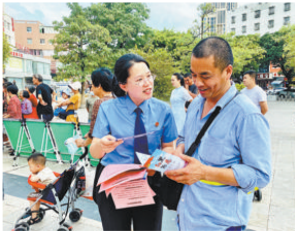
▲检察院工作人员向市民开展普法宣传。