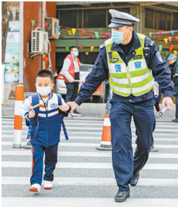
▲民警守护学生上学路。

五年来,先进典型不断涌现,厦门政法“国字号”荣誉辉煌——连年派出所被中共中央、国务院授予“全国模范公安单位”称号、厦门市公安局荣获“全国公安机关执法示范单位”。厦门市司法局被司法部授予“公共法律服务先进集体”、厦门市法律援助中心被司法部授予“全国法律援助工作先进集体”荣誉称号。厦门市检察院被中央文明委授予“全国文明单位”称号。海沧区人民法院被授予“全国模范法院”,思明区人民法院、集美区人民法院获评“全国优秀法院”……凝聚起推进过硬队伍建设的正能量。