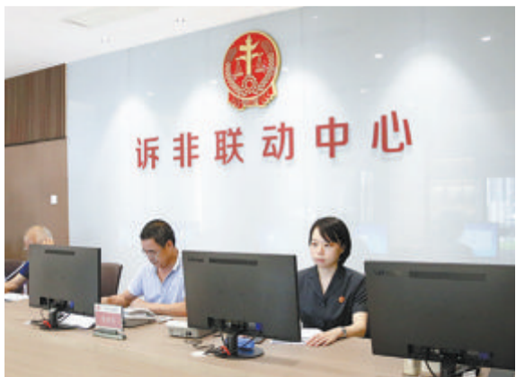
▲法院诉非联动中心特邀调解员入驻工作。