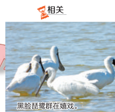
黑脸琵鹭群在嬉戏。

旅游消费的一大热点。那么,樱花为何年年引爆客流量? 集美大学工商管理学院副教授江航表示,首先,樱花绚丽烂漫,花团锦簇,花语是爱情与希望,因此樱花自带网红气质,从而引发网络上出现了大量樱花打卡地。 其次,随着近年来厦门乡村振兴战略的持续推进,“花海经济”已经成为乡村振兴的重要引擎。例如,“第三届汉服寻樱·全国首个零碳樱花节”将在同安莲花镇白交祠村启动;再比如,近日开幕的“清新福建 花开永福”2023福建樱花文化旅游节暨漳平市第十二届樱花文化旅游节上,福建十大浪漫樱花打卡地和十条赏樱线路揭晓,厦门翔安内厝厝山村的妙高山樱花茶园入选。 此外,江航认为,网络平台的流量推广也推动了“樱花经济”。据悉,不少市民都是从网络平台等渠道看到赏樱攻略,前来打卡。