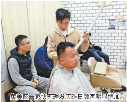
集美区一家快剪理发店昨日顾客明显增加。

本报讯(文/图 记者 张玉榕)农历二月初二,民间称为“龙抬头”,而今年有两个“龙抬头”。昨日,记者走访多家理发店发现,不少中老年人赶“第一趟车”踩着点理发,但是也有部分年轻人不紧不慢,计划等下一个“二月二”,再去剪发讨个好彩头。