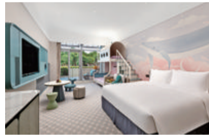
拥有“大床+高低床+超大露台”的特色亲子房。