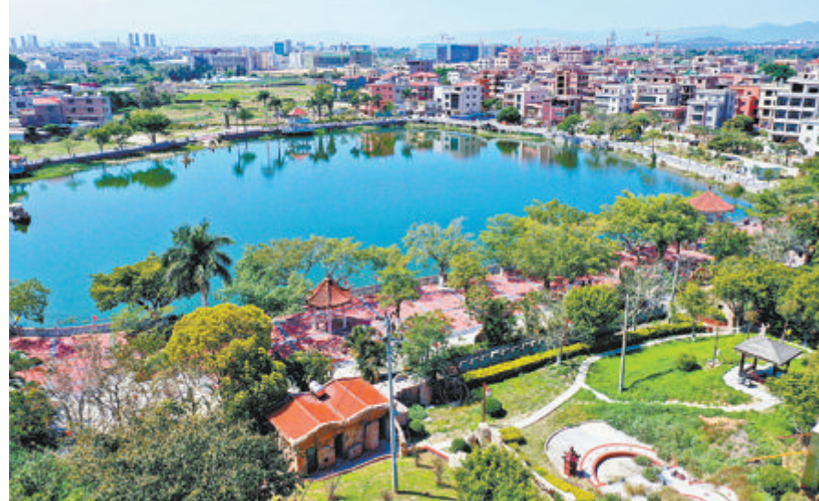
内厝镇勇当发展急先锋,全力将全域打造为翔安区“产城人”融合的新地标。图为莲塘村。

第一季度,内厝镇已经积极行动起来:一方面,党政主要领导组建了综合性招商团队,到外市、外省寻找招商引资项目;另一方面,内厝还将加大第一季度中介招商奖励倾斜力度,充分调动中介招商热情,寻找更多好项目。