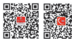
关注“厦门日报”或“翔翔民安”微信公众号查看访谈视频。

百舸争流,奋楫者先。内厝镇将以“排头兵”的自觉,以“拼”的姿态、“抢”的状态、“闯”的劲头,用第一季度“开门红”带动全年“满堂红”,用扎扎实实的工作成效和实实在在的民生成果,为奋力建设“五个翔安”贡献内厝力量,以实际行动迎接翔安区建区20周年。