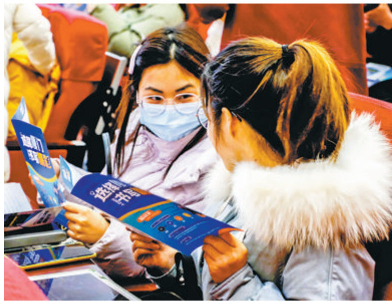
学生正在认真了解厦门引才政策。

本报讯(记者 何无痕)2月22日,厦门2023年首场引才推介会在武汉举办,正式拉开了我市春季招聘的序幕。据了解,我市抢抓“开学季”,70余条赴省内外招聘线路正蓄势待发,招才引智按下“快进键”,校园招聘全速推进。