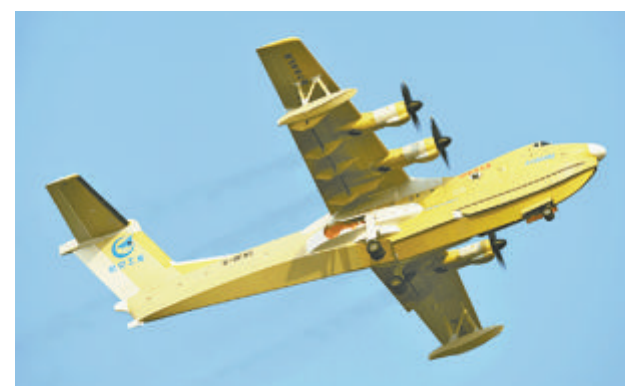
昨日在珠海成功试飞的“鲲龙”AG600M飞机。

据央视新闻报道 昨日，我国自主研发的第四架大型灭火/水上救援水陆两栖飞机“鲲龙”AG600M在广东珠海首次飞行成功，标志着AG600M全面进入适航取证试飞。