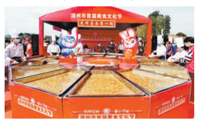
▲直径6米的“花样卤面第一锅”。

本报漳州讯(文/图 特派记者 黄树金)以“花样漳州 食全食美”为主题的漳州市首届美食文化节,在漳州高新区三馆广场举办两天来,吸引数万市民游客参与。其中号称全球“花样卤面第一锅”的开煮最为吸睛,供市民游客免费品尝。另有400家精品美食商户,展出3000多个美食品项。活动将持续至今日。