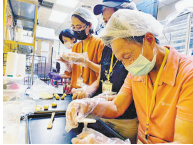
2022年9月,高雄市劳工局举办“二度就业妇女重返职场工作坊计划”,77岁老人也来参加培训。图为学员学习制作蛋糕。(资料图)

在支援服务业,台湾中老年就业者占比15.25%,为最高。台湾求职网站“Yes123”发言人杨宗斌分析称,支援服务业涵盖保安、清洁派遣等工作,大多工时短,工作环境没那么好,比较难招募到年轻人,另一方面,职场仍有年龄歧视,二度就业的中高龄人士求职不易,导致他们最后大多做一些年轻人不愿意做的工作。不过,杨宗斌补充说,撇开体力因素,中高龄就业者被认为比年轻人更有责任感、抗压性高,对雇主而言,这是中高龄就业者很重要的优点。另外,台当局有关部门的统计数据表示,台湾65岁以上老年人人口今年1月已超过410万人,占比达17.6%。台当局去年预计,2025年台湾老年人口占比将超过20%,台湾将迈入“超高龄社会”。