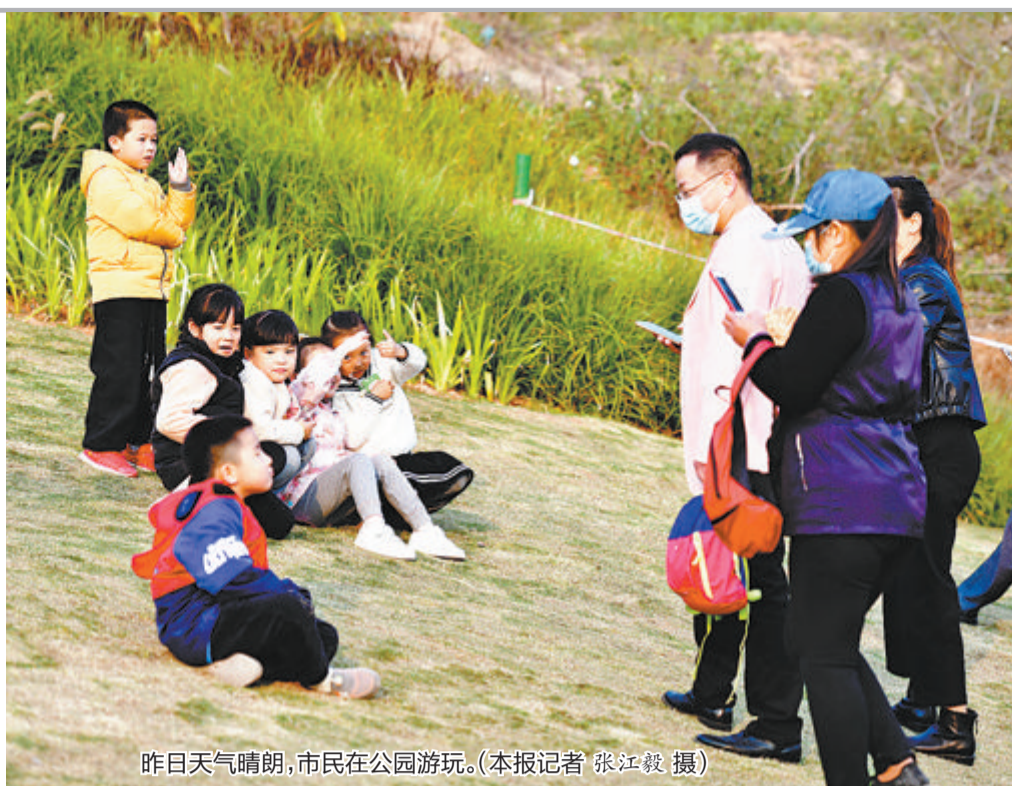
昨日天气晴朗,市民在公园游玩。

当日全食发生时,太阳的亮面被月亮遮住,光线暗淡,边缘的日珥也会变得明显,此时人们有概率直接用肉眼观测到日珥。但陈栋华表示,这种情况下,人们看到的大部分是日冕与色球层,日珥依旧不易用肉眼捕捉。“要想清晰地观察日珥,还是要找一个晴朗无云的白天,用专业的H-α滤镜。”陈栋华说。