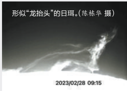
形似“龙抬头”的日珥。