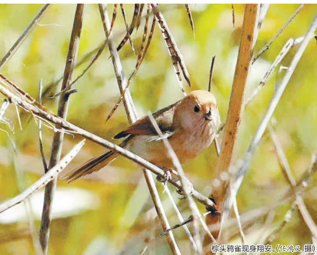
棕头鸦雀现身翔安。

此次发现中华白海豚的海澄镇月港,位于九龙江下游,为福建历史上的“四大商港”之一。