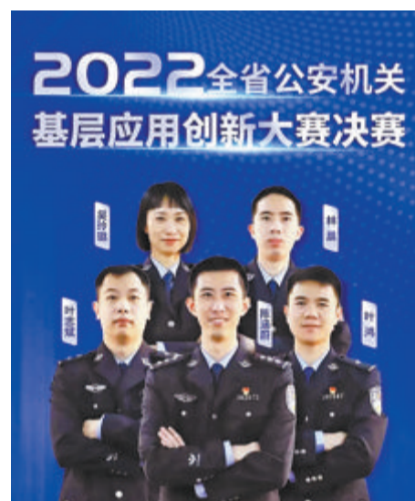
2022年全省公安机关基层应用创新大赛一等奖团队:市公安局刑侦支队代表队。

近日,市公安局在全省公安机关基层应用创新大赛中,斩获团体总分第一,勇夺三连冠。