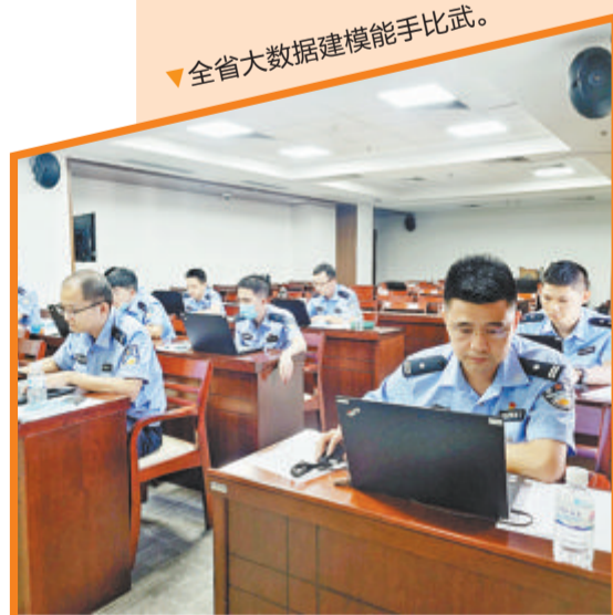
全省大数据建模能手比武。