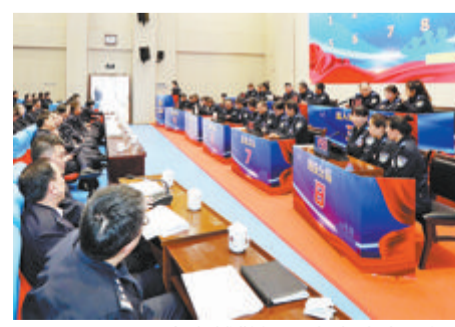
全市辅警知识竞赛决赛现场。

本报讯(文/图 通讯员 厦公宣)2月28日,市公安局举办警务辅助人员知识竞赛决赛。此次竞赛分为初赛和决赛,15支代表队75名队员经过初赛的激烈角逐,产生8