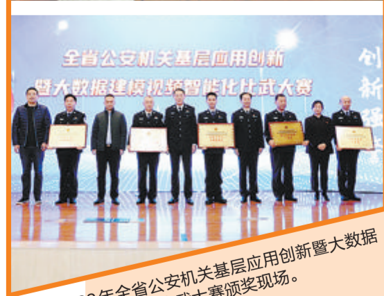
2022年全省公安机关基层应用创新暨大数据建模视频智能化比武大赛颁奖现场。