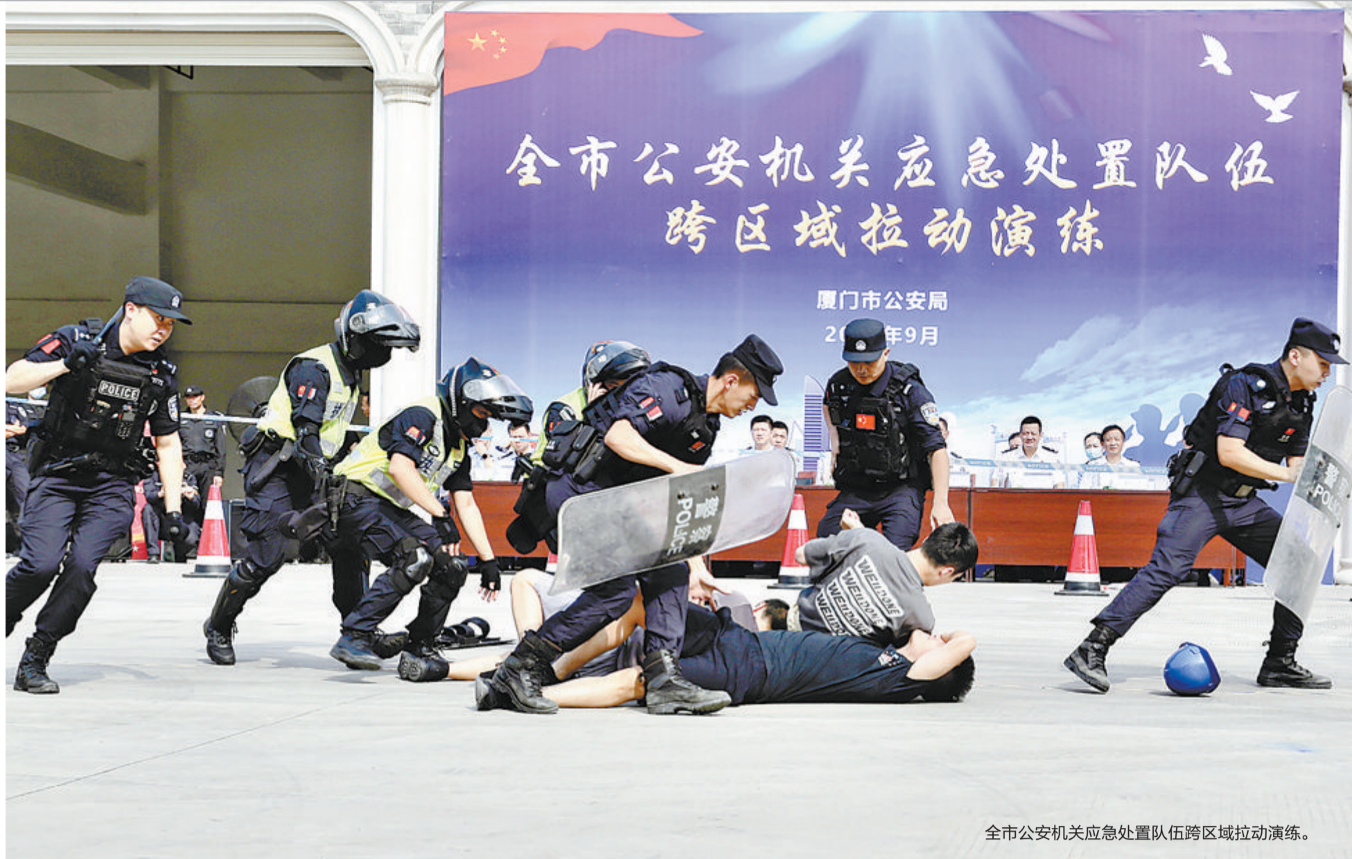
全市公安机关应急处置队伍跨区域拉动演练。

训练场上,特警队员障碍跑、徒手攀爬,“魔鬼训练”不断挑战身体极限;阶梯教室里,警务辅助人员知识竞赛现场气氛紧张、竞争激烈;地铁里,应急处置的模拟现场,巡逻队员第一时间发现“危险”,成功制服“犯罪嫌疑人”…… 2019年全国公安机关开展全警