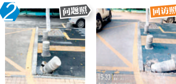
2 同安区环城南路大唐世家六期北侧(佰胜脚轮叉车)旁止车石出现倾斜、歪倒问题。经现场核查,该问题未整改。