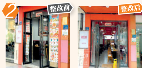
2 集美区侨英街道海南昌里34号淳百味沙县食记违规张贴广告问题。经现场核查,该问题已完成整改。