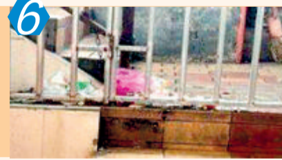
6 考评项目:农贸市场 考评点位:集美区白泉市场 考评情况:该点位主要通道杂物乱堆放、边角垃圾清理不到位、立面脏污等问题,测评成绩77.00分