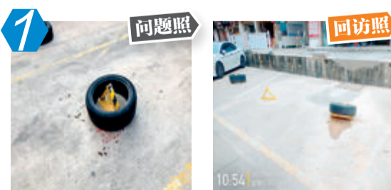
1 湖里区金山西路46-28路设置停车设施问题。经现场核查,该问题未整改。