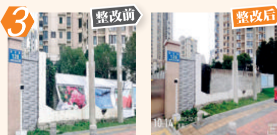
3 海沧区霞光路128号户外公益广告破损问题。经现场核查,该问题已完成整改。