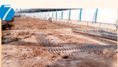
7 考评项目:扬尘防治(行业考评) 项目名称:同翔基地同安东路(同新路—新324国道段)综合管廊工程土建工程 监管单位:市建设局 建设单位:厦门市市政廊投资管理有限公司 建设情况:该项目施工现场出入口及周边存在严重扬尘污染现象,围挡上方未设置喷淋头,未设置净车设施,部分区域黄土裸露,未采取有效防尘措施。