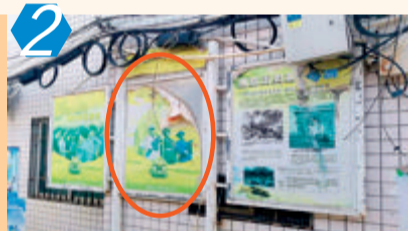
2 考评项目:城区社区C类(城乡接合部) 考评点位:翔安区下许社区 考评情况:该点位主要存在乱堆杂,宣传牌、指示牌破损,建筑材料堆放不规范等问题,测评成绩72.00分