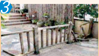
3 考评项目:小区 考评点位:海沧区鹭景湾 考评情况:该点位主要存在非机动车乱停放,垃圾落地,楼道设施破损,物品乱摆放等问题,测评成绩76.00分