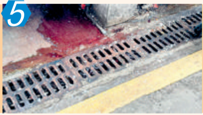
5 考评项目:农贸市场 考评点位:同安区潘涂市场 考评情况:该点位主要存在乱堆杂、乱张贴,地面脏污、排水设施堵塞等问题,测评成绩73.00分