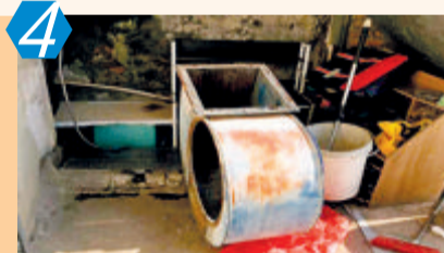
4 考评项目:主次干道(商业大街) 考评点位:思明区前埔南路 考评情况:该点位主要存在乱堆杂、乱张贴、跨店经营等“门前三包”管理不到位问题,测评成绩75.00分