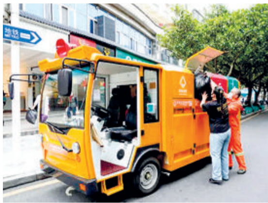
海沧区创新探索环卫作业模式，加大机械化投入提升作业效率。

下一步，市创建办和市城管办将加强文明创建重点部位考评，并对考评发现问题进行“回头看”检查，全力争创全国文明城市。