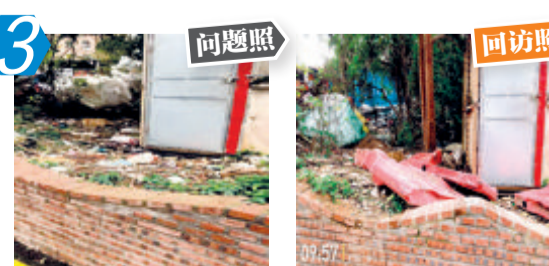
3 同安区官浔路西官浔里244号垃圾堆积问题。经现场核查,该问题未整改。