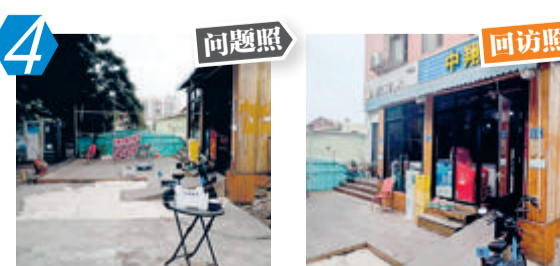
4 翔安区新店福祥路62-101号旁“门前三包”落实不到位问题。经现场核查,该问题出现回潮。