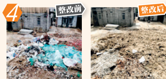
4 同安区五显镇后塘里438号乱堆杂问题。经现场核查,该问题已完成整改。