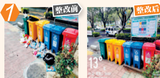
1 思明区湖滨南路34号前垃圾收集点垃圾堆积问题。经现场核查,该问题已完成整改。