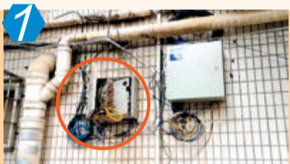
1 考评项目:城区社区AB类 考评点位:思明区希望社区 考评情况:该点位主要存在缆线杂乱,飞线充电,乱堆杂,机动车、非机动车乱停放等问题,测评成绩70.00分