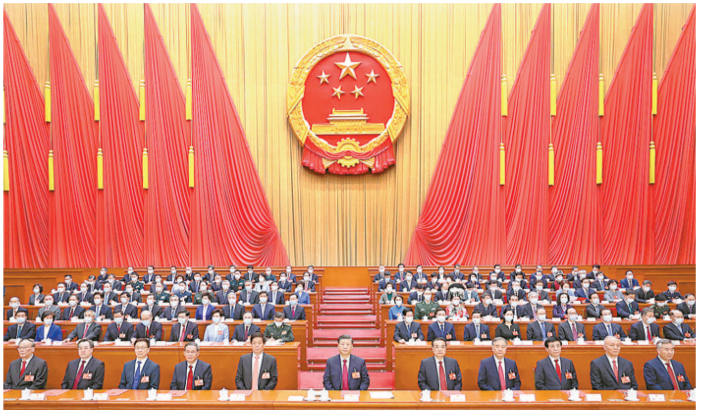
▲3月13日,第十四届全国人民代表大会第一次会议在北京人民大会堂闭幕。习近平等党和国家领导人在主席台就座。新华社发 ▲中共中央总书记、国家主席、中央军委主席习近平发表重要讲话。新华社发

新华社北京3月13日电 中华人民共和国第十四届全国人民代表大会第一次会议,在圆满完成各项议程,产生新一届国家机构组成人员后,13日上午在北京人民大会堂闭幕。