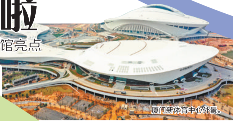
厦门新体育中心外景。

一赛激活产业、一馆牵动民生。在厦门东部这片新天地,绵延千年的“人文精神”得以传承,“人人参与体育、体育造福人人”的美好愿景,也将随着凤凰体育馆的建成投入使用逐渐实现。