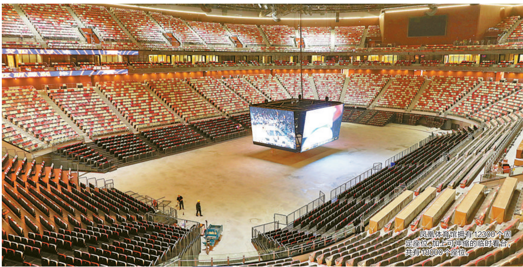
凤凰体育馆拥有12300个固定座位,加上可伸缩的临时看台,共有18000个座位。