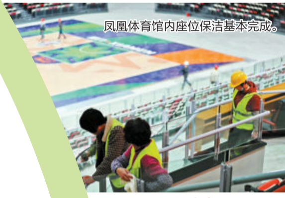
凤凰体育馆内座位保洁基本完成。

从无障碍看台到最近的场馆出入口距离仅30多米,不到2分钟即可到达;场馆内无障碍通道多达12处,几乎覆盖了体育馆主要通行区域。