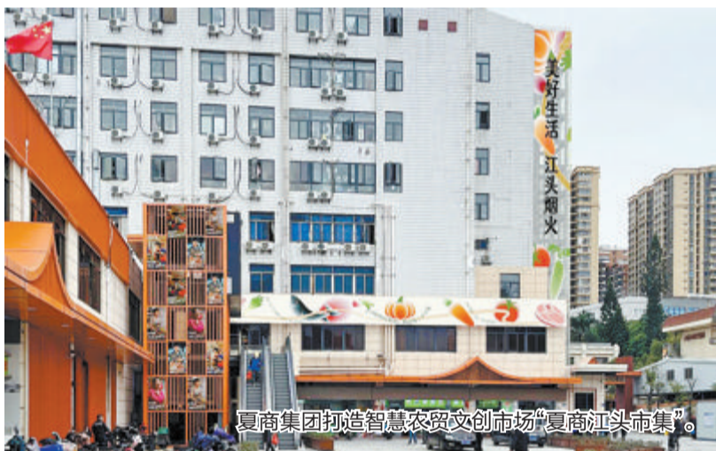
夏商集团打造智慧农贸文创市场“夏商江头市集”。

2002年厦门商业集团改制为有限责任公司,2005年12月,厦门商业集团正式改名“厦门夏商集团有限公司”,并启动了集团统一品牌战略,夏商集团直面全球经济化浪潮,紧抓发展机遇,又开始了纵深推进改革开放的新征程。