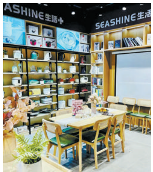
夏商集团打造“SEASHINE 生活+”全新社区零售业态。

当时,夏商集团公司以百货批发公司、华联商厦等企业为核心企业。以第一百货、华联商厦为代表的百货商场在厦门不断扩大并实现连锁经营。夏商集团以华联商厦、好清香等为试点,率先开启厦门发展连锁商业的大幕,这一时期,东海大厦、华联酒店、外供大楼等商业大楼拔地而起,友谊商场、大丰商厦、一百利景商厦、商业大厦等大型综合商场相继出现,华联百货成为福建省销售额第一的大型综合型零售商场。此外,江头蔬菜批发市场、滨海(西堤)蔬菜批发市场、高崎禽蛋批发市场等相继投入使用,生猪定点屠宰工作率先在厦门实施,公司+农户+订单模式探索推行,合作经营厦门“农改超”的第一家大型生鲜超市……民生项目接连上马,不断发展,更加突出了夏商集团的“主渠道”地位。