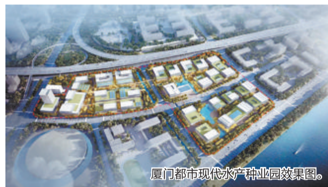
厦门都市现代水产种业产业园效果图。

新时代,中国市场开放之门不断拓宽。夏商集团积极响应市委市政府号召,搭乘“一带一路”快车,加强国际合作,启动全球直采业务,先后与多个国家和地区达成商贸合作协定,将进口牛羊肉、特色农产品、海产品、日用品、水果等优质特产引入中国并设立专柜,推进企业从基础民生向中高端发展、从区域化向国际化、从“企业国际化”向“国际化企业”转型升级,在全球范围内持续健康发展。