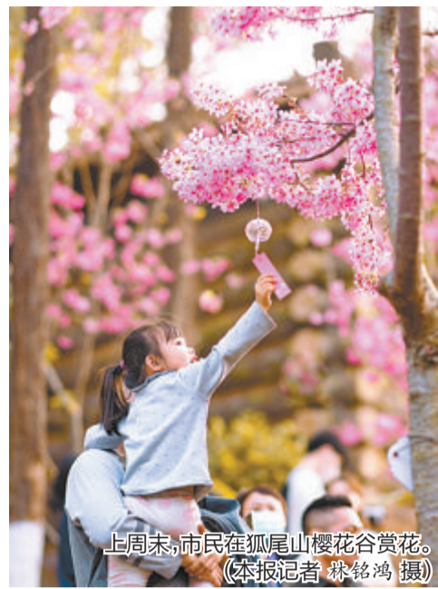
上周末,市民在狐尾山樱花谷赏花。