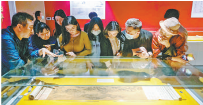
▲市民在馆内听取讲解。

跨过2000多公里到达后,这批“乘客”又被小心翼翼地搬到专车搬上船上,渡江,前往位于鼓浪屿的“新家”。布展中,工作人员同样花费巨大心血,防止书画在展览过程中意外掉落破损。展柜中也放置了温湿度计、恒湿机,实时精准把控展览环境中的湿度与温度。