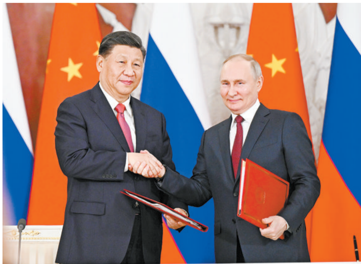
▲会谈后，两国元首共同签署《中华人民共和国和俄罗斯联邦关于深化新时代全面战略协作伙伴关系的联合声明》和《中华人民共和国主席和俄罗斯联邦总统关于2030年前中俄经济合作重点方向发展规划的联合声明》。

新华社莫斯科3月21日电 当地时间3月21日下午，国家主席习近平在莫斯科克里姆林宫同俄罗斯总统普京举行会谈。两国元首就中俄关系及共同关心的重大国际和地区问题进行了真挚友好、富有成果的会谈，达成许多新的重要共识。双方一致同意，本着睦邻友好、合作共赢原则推进各领域交往合作，深化新时代全面战略协作伙伴关系。 3月的莫斯科，天朗气清。习近平乘车抵达克里姆林宫时，克里姆林宫迎宾马队