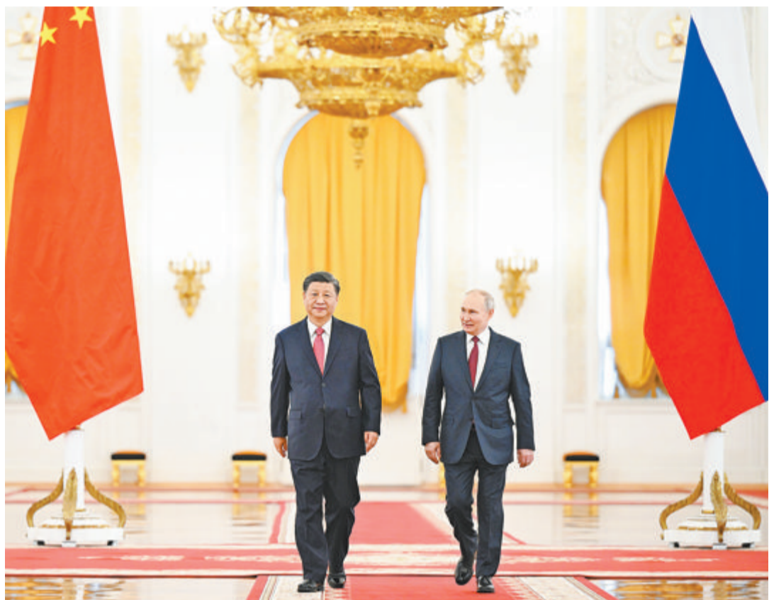
▲当地时间3月21日下午，国家主席习近平在莫斯科克里姆林宫同俄罗斯总统普京举行会谈。这是普京在乔治大厅为习近平举行隆重欢迎仪式。