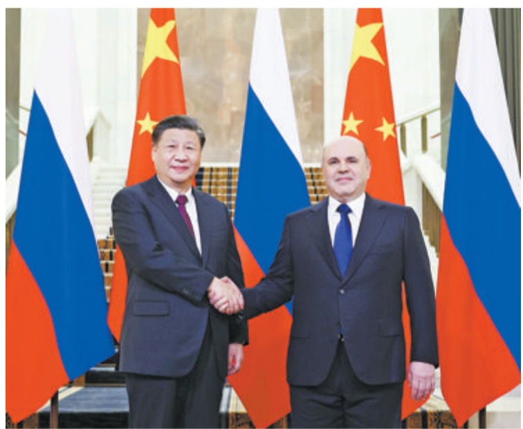
▶当地时间3月21日上午，国家主席习近平在俄罗斯联邦政府大厦会见俄罗斯总理米舒斯京。

米舒斯京表示，今天我率俄罗斯政府几乎所有重要内阁成员一起同习近平主席会见，对习近平主席对俄罗斯进行国事访问表示热烈欢迎。(下转A02版)