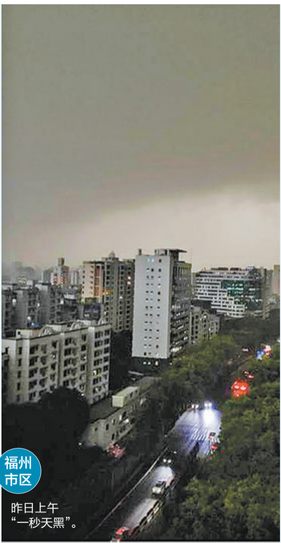
福州市区 昨日上午“一秒天黑”。