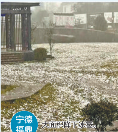
宁德福鼎 大面积降下冰雹。